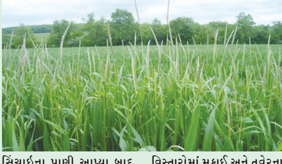
સિંચાઈના પાણી આપ્યા બાદ વરસાદ વરસ્યો જેના કારણે ખેતીનું ચિત્ર સુધારા ઉપર આવ્યું છે. અરવલ્લી જિલ્લા ખેતી વિસ્તારોમાં મકાઈ અને તુવેરના આંતર પાકનું આયોજન કરતું જોઈએ તેમ જણાવી રહ્યા છે. જેથી વરસાદ ની ઘટ કે વધુ

જે.આ વર્ષે પણ એવું જ થયું જેમાં વાવાઝોડાની અસરથી વરસેલા વરસાદને નિયમિત ચોમાસું માની ખેડૂતો ભૂલ કરી બેઠા હતા પરંતુ પાછળ થી અધિકારી જે.આર. પટેલ પણ ચોમાસાની પેટર્ન બદલાઈ હોવાનું સ્વીકારી ખેડૂતો એ ચોમાસું સિઝનમાં દેખા દેખીમાં વાવેતર કરવાના બદલે ટ્રાયબલ વરસાદ સમયે ખેડૂતો મોટા નુકસાનથી બચી શકે. જોકે હાલ તો બંને જિલ્લામાં ખેતી માટે સારો વરસાદ વરસી રહ્યો છે તે જોતાં પાક માટે અનુકૂળ માહોલ છે. ઉલ્લેખનીય છે કે સાબરકાંઠા અને અરવલ્લી જિલ્લામાં ખરીફ ખેતીમાં ભાદરવાના વરસાદથી ફાયદો જ ફાયદો છે પણ સપ્ટેમ્બર ના અંત સુધી સતત વરસાદની હાજરી રહી તો નુકસાનરૂપ સાબિત થવાની સંભાવના ખેતી સૂત્રો વ્યક્ત કરી રહ્યા છે. આ વર્ષે વાવેતર પછી વરસાદ ખેંચાતા ખેડૂતોના જીવ ઉચાટમાં આવી ગયા હતા પણ હવે સાર્વત્રિક વરસાદ થી ખેડૂતોના જીવને ઠંડક મળી છે.