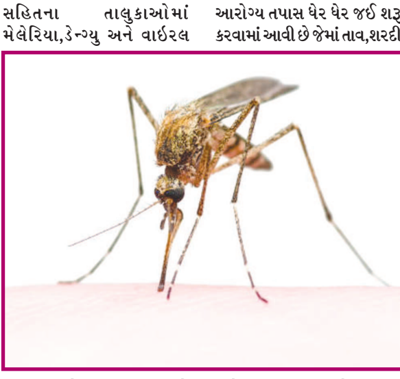
ભીમારીના કેસમાં સતત વધારો થતાં ૨, ૧૬, ૫૧૮ લોકોની આરોગ્ય તપાસ ધેર ધેર જઈ શરૂ કરવામાં આવી છે જેમાં તાવ, શરદી લઈ લેબોરેટરી પરીક્ષણ માટે મોકલી આપ્યા છે. વર્તમાન સિઝનમાં ડેન્ગ્યુ ના રોગચાળાએ માથું ઉચ્કવ્યું છે જેના કારણે તંત્ર દોડતું થયું છે. વરસાદ બાદ જિલ્લામાં મચ્છરનો ઉપદ્રવ વધી જતાં ભીમાર દર્દીઓથી દવાખાના ઉભરાઈ રહ્યા હોવાથી ખાસ કરીને સર્વેલન્સ ઉપર વધુ ધ્યાન રાખી ૧૦૩૩ સ્થળેએ મચ્છરો ના નાશ માટે કામગીરી હાથ ધરવામાં આવી છે. હમણાં સુધી આરોગ્ય વિભાગ જે વિસ્તારોમાં મેલેરિયા કે શંકાસ્પદ ડેન્ગ્યુ નો કેસ નોંધાય તે વિસ્તારમાં દવા છંટકાવ માટે દોડતું હતું પણ હવે વાહકજન્ય રોગચાળો વધુ વકરતાં તમામ વિસ્તારોને આવરી લઈ આરોગ્યલક્ષી કામગીરી શરૂ કરી છે.

મોડાસા (બુરો ઓફીસ) તા. ૨૨ અરવલ્લી જિલ્લામાં મચ્છરજન્ય રોગચાળો બેકાબુ બનતાં આરોગ્યતંત્ર ઉંધા માથે પડેકાવ્યું છે. વરસાદ બાદ વાહકજન્ય રોગચાળો રોકવાની કામગીરી બેઅસર સાબિત થઈ છે. જેથી વિભાગ દ્વારા જિલ્લાના ૧૭૪ ગામોમાં તાબડતોબ સર્વેલન્સ શરૂ કર્યો છે. આરોગ્યની ૩૨૭ ટીમો એ ૧૦૩૩ સ્થળેથી મચ્છરની ઉત્પતિ શોધી કાઢી દવાનો છંટકાવ શરૂ કર્યો છે.