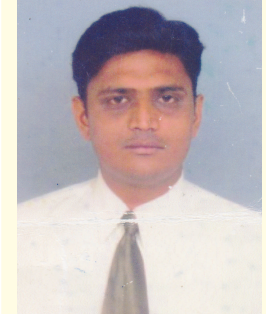
તીર્થ પંડ્યા ડાયરેક્ટ, લોક ઈન્ફોગેશન વર્લ્ડ