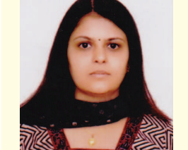
નીતા રાણા લાયોનેસ ક્લબ