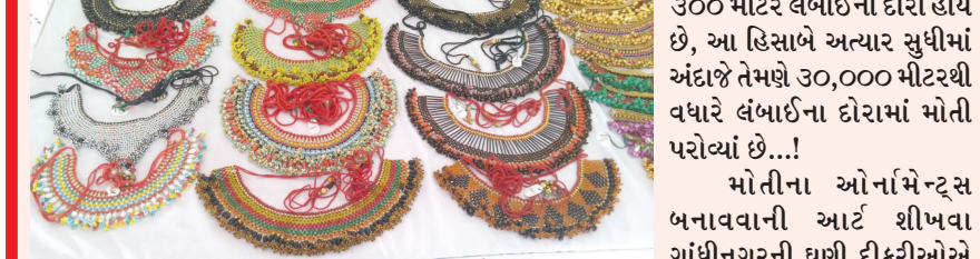
હિરલ ભટ્ટના મોતીના ઓનલાઈન સુધી ગાંધીનગર અને અમદાવાદ ઉપરાંત ગુજરાત બહાર પણ સારી માંગ છે.

ગણિત માંડીએ તો પ્રત્યેક રીલમાં ૩૦૦ મીટર લંબાઈના દોરા હોય છે, આ હિસાબે અત્યાર સુધીમાં અંદાજે તેમણે ૩૦,૦૦૦ મીટરથી વધારે લંબાઈના દોરામાં મોતી પરોવ્યાં છે...!