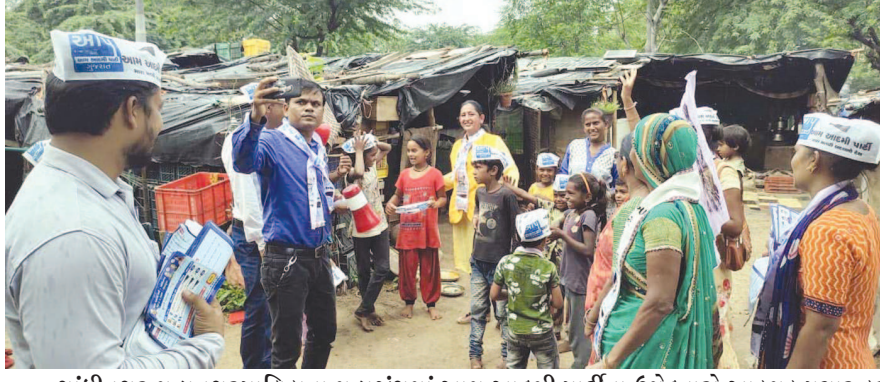
ગાંધીનગર મહાનગરપાલિકાના મહાજંગમાં આમ આદમી પાર્ટીના ઉમેદવારો આક્રમક પ્રચાર કરી રહ્યા છે. આમ આદમી પાર્ટીના ઉમેદવારોએ અક્ષરમા ખાતે ચૂંટણી પ્રચાર કરી ઉમેદવારોને રીઝવવાનો પ્રયાસ કર્યો હતો.