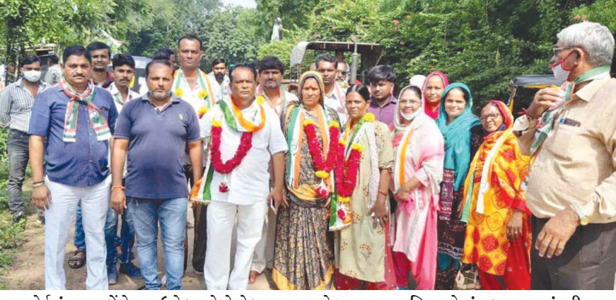
વોર્ડ નં. ૪ ના કોંગ્રેસના ઉમેદવારોએ સેક્ટર-૨૦ અને આસપાસના વિસ્તારોમાં જબરજસ્ત ચૂંટણી પ્રચાર કર્યો હતો. બોરીજ ગામમાં જઈ ગ્રામવાસીઓને કોંગ્રેસની તરફેણમાં મતદાન કરવા સમજાવ્યા હતા.