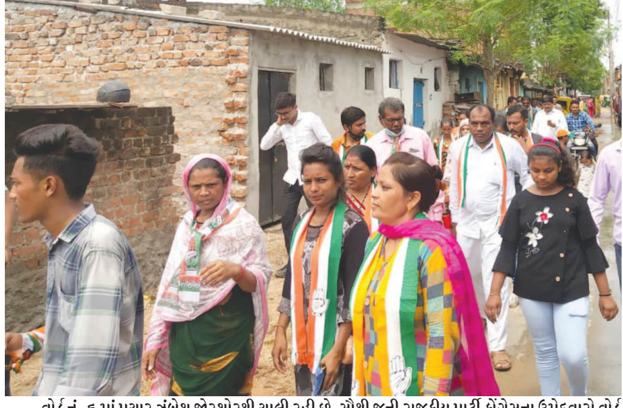
વોર્ડ નં. ૬ માં પ્રચાર ઝુંબેશ જોરશોરથી ચાલી રહી છે. સૌથી જુની રાજકીય પાર્ટી કોંગ્રેસના ઉમેદવારો વોર્ડ નં. ૬ માં સમાવિષ્ટ ગોકુલપુરામાં પ્રચાર કરી રહ્યા છે. વસાહતીઓ તરફથી ખૂબ જ સારો પ્રતિસાદ મળી રહ્યો છે.