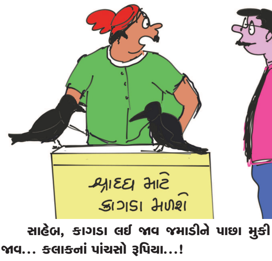
સાહેબ, કાગડા લઈ જવ જમાડીને પાછા મુકી જવ... કલાકનાં પાંચસો રૂપિયા...!