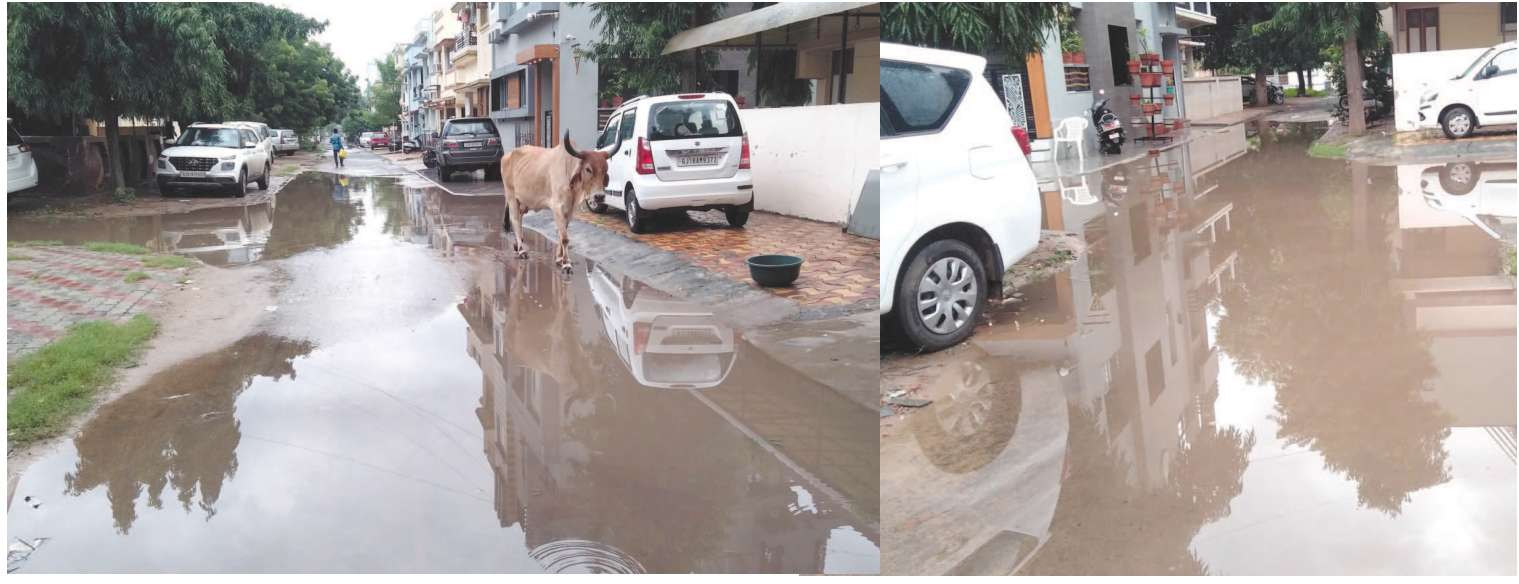
ગાંધીનગરમાં હળવા વરસાદી ઝાપટા ચાલુ રહ્યા છે. વારંવાર આવતા ઝાપટાના કારણે શહેરમાં ઠેર ઠેર પાણીના ખાબોચિયા ભરાઈ જાય છે. ઘણા સ્થળોએ કાદવ કચિડ પણ જોવા મળી રહ્યો છે. વારંવાર પડતા વરસાદના કારણે મચ્છરોનો ઉપદ્રવ પણ વધ્યો છે.