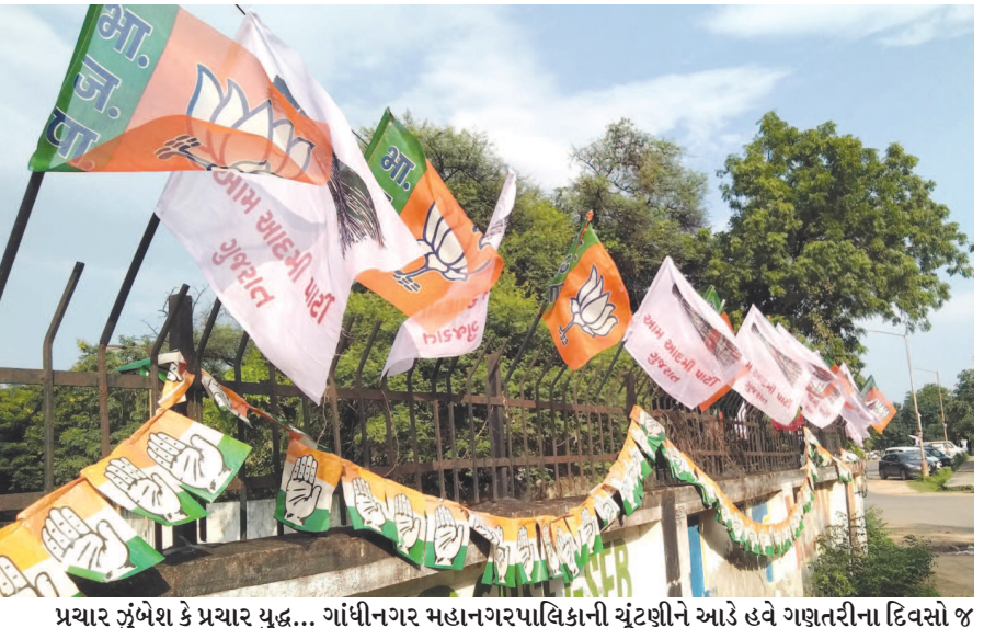
પ્રચાર ઝુંબેશ કે પ્રચાર યુદ્ધ... ગાંધીનગર મહાનગરપાલિકાની ચૂંટણીને આડે હવે ગણતરીના દિવસો જ બાકી રહ્યા છે ત્યારે પ્રચાર ઝુંબેશ તેની ચરમસીમાએ પહોંચી છે. જ્યાં જુઓ ત્યાં ઉમેદવારોના અને વિવિધ રાજકીય પાર્ટીના બેનર જોવા મળી રહ્યા છે. ત્રણેય મોટી રાજકીય પાર્ટીના બેનર જાહેર સ્થળોએ જોવા મળી રહ્યા છે. મતદારોને રીહવવાના તમામ પ્રયાસો થઈ રહ્યા છે.

હતું. જેમાં જરૂરિયાતમંદોને ૩ કિલો ચોખા, બિસ્કીટ, બલ્બ, એક કિલો મીઠું, દૂધીનું બિયારણનું વિતરણ કરવામાં આવ્યું હતું. જે ભિલોડાના ગામોમાં જરૂરિયાતમંદો માટે સેવાકાર્ય કર્યું હતું.