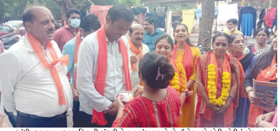
ગાંધીનગર મહાનગરપાલિકાની ચૂંટણીનો મહાજંગ જામ્યો છે. ઉમેદવારો એડી ચોટીનું જોર લગાવી મહાનગરના જંગમાં જીતનો અવસર મેળવવા થનગની રહ્યા છે. વોર્ડ નં. ૩ માં ભાજપના ઉમેદવારોએ ડોર ટુ ડોર ચૂંટણી પ્રચાર કરી મતદારોને આકર્ષવાનો પ્રયાસ કર્યો છે. સેક્ટર-૨૪ છાપરા અને શિવમ ફલેટ વિસ્તારમાં ભાજપના ઉમેદવારોએ આક્રમક પ્રચાર કર્યો હતો.