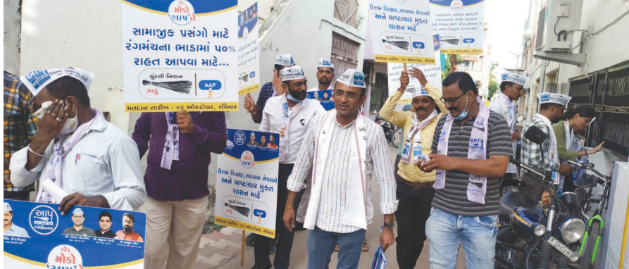
વોર્ડ નં. ૬ માં આમ આદમી પાર્ટીના ઉમેદવારોએ ઉત્સાહભરે પ્રચાર કર્યો હતો. સેક્ટર-૧ પના વિવિધ વિસ્તારમાં આમ આદમી પાર્ટીના ઉમેદવારો વસાહતીઓને મળ્યા હતા અને આપને મત આપવા અનુરોધ કર્યો હતો.