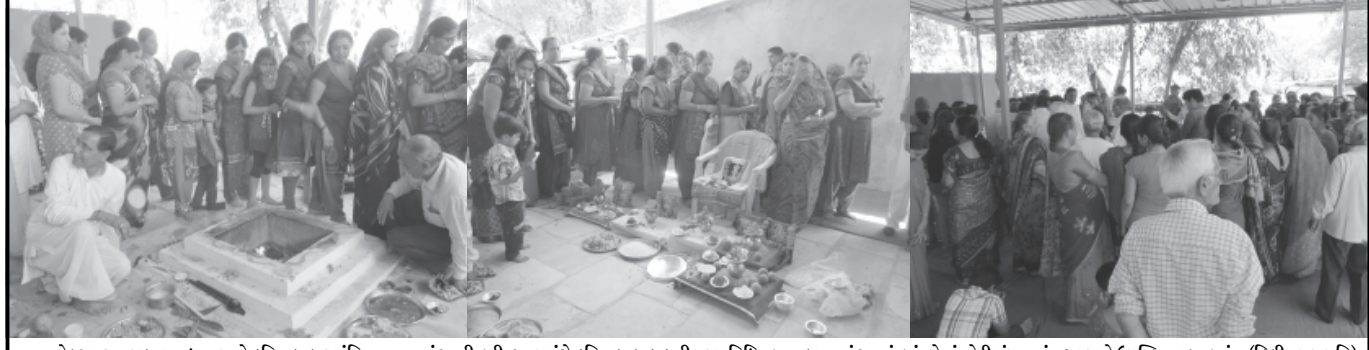
સેક્ટર-૨૯ જલારામ ધામ ખાતે દરિયાલાલ જયંતિ મનાવવામાં આવી હતી. આ પ્રસંગે દરિયાલાલ દાદાની પૂજાનવિધિ, હવન કરવામાં આવ્યું હતું. જેમાં મોટી સંખ્યામાં નગરજનો ઉપસ્થિત રહ્યા હતાં.