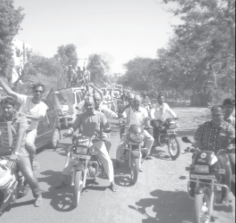
ત્યારે ગાંધીનગર મહાનગર દ્વારા વિકાસ યાત્રાનું આયોજન કરવામાં આવ્યું છે. વિકાસ યાત્રા ત્રણ દિવસ શહેર ઉપરાંત ગામડામાં ફરી વિકાસની વાત કરશે. ભાજપના વડાપ્રધાન પદના ઉમેદવાર નરેન્દ્રભાઈ મોદીને પ્રધાનમંત્રી બનાવવા માટે ગાંધીનગર મહાનગર દ્વારા ત્રણ દિવસ વિજય વિકાસ યાત્રા કાઢવામાં આવશે.

ગાંધીનગર, તા. ૧ લોકસભાની ચૂંટણી જેમ જેમ નજીક આવી રહી છે તેમ તેમ રાજકીય પક્ષો કમર કસવા લાગ્યા છે ગાંધીનગર, તા. ૧ વિકાસ યાત્રાના શરૂઆત પ્રથમ દિવસે સેક્ટર-૧ ગાયત્રી મંદિરથી શુભારંભ કરવામાં આવ્યો હતો અને સે-૧૭ પૂર્ણાહુતિ કરવામાં આવશે. યાત્રામાં હનુમાનજી મંદિર ખાતે પૂર્ણાહુતિ સવારે ધોળાકુવા, ઈન્દ્રોડા, બોરીજ, બાસણ, પાલજ, જીઈબી ખાતે ફરી ભાજપ સરદાર દ્વારા કરવામાં આવેલા