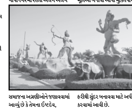
સમાજના અગ્રણીઓને જણાવવામાં આવી છે કે તેમના ઈષ્ટદેવ, ફરીથી સુંદર બનાવવા માટે અપીલ કરવામાં આવી છે.

રાજ્યના અનેક શહેરોમાં કરવામાં આવ્યું છે. તેમાં ગાંધીનગરનો પણ સમાવેશ થાય છે. ગાંધીનગર સે-૩૦માં આવેલ મુકિતધામનું ૯ વર્ષ અગાઉ નવીનીકરણ કરવામાં આવ્યું હતું. આ મુકિતધામમાં ભગવાન શ્રી કૃષ્ણ-રાધા, શિવજી, સહિતના દેવી દેવતાઓની મૂર્તિઓ પ્રસ્થાપિત કરવામાં આવી છે આ મૂર્તિઓ ખૂબ જ કલાત્મક છે પરંતુ આ મૂર્તિઓ છેલ્લા થોડાક સમયથી ખંડિત થઈ તૂટી જવા પામી છે જે ખરેખર દુ:ખદ બાબત છે. ગાંધીનગરની જુનિયર