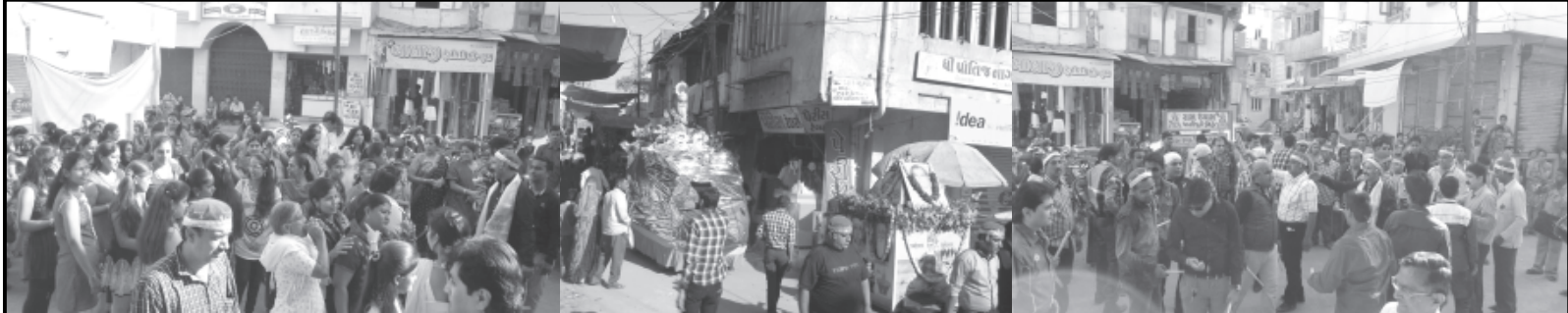
સાબરકાંઠાના પ્રાંતિજ નગરમાં આજે સિંધી સમાજ દ્વારા ચેટીયાંદ પર્વની ઉલ્લાસપૂર્વક ઉજવણી કરવામાં આવી હતી. સિંધી ભાઈ-બહેનોએ પ્રાંતિજની ઉડી ફળી ખાતે આવેલ મંદિર ખાતે પૂજા-આરતી કરી ઝુલેલાલજીની ભવ્ય શોભાયાત્રા કાઢવામાં આવી હતી. જેમાં મોટી સંખ્યામાં સિંધી સમાજના લોકો જોડાયા હતા.