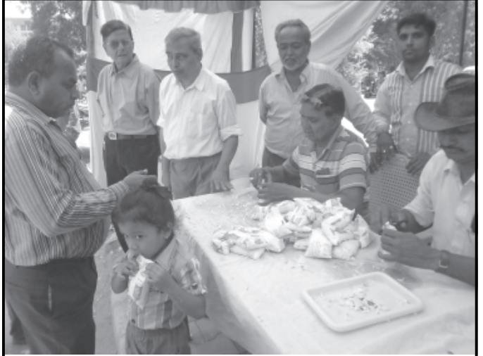
જી.સી.કા. દારા ૩ મહીના સુધી ઈંડી છાશનું વીતરણ કરવામાં આવી રહ્યું છે. રોજની લગભગ ૨૦૦૦ જેટલી છાશનું વિતરણ કરવામાં આવે છે.