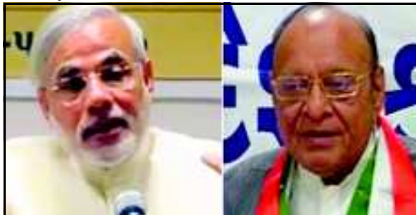
અગાઉ પૂર્વ મુખ્યમંત્રી શ્રી હિતેન્દ્ર આક્રમક પ્રહારો માટે જાણીતા છે. બંને કપડવંજ ઉપરાંત ગોધરા, રાજ્યના રાજકારણમાં પોતાની સર્વપરિતા સિદ્ધ કરી ચુક્યા છે. બંને નેતાઓ રાજકીય વ્યુહરચનાના માહિર છે. આ બંને નેતાઓને ચૂંટણી લડતા જોઈ રાજકીય પંડિતોમાં અનેકવિધ વાતો ચર્ચામાં છે. એક તબક્કે અડવાણી માટે ગાંધીનગરની બેઠક વાઘેલાએ પાલી કરી આપી હતી તો મુખ્યમંત્રી શ્રી મોદી ગાંધીનગરથી જ આ ચૂંટણી લડે તેવો આગ્રહ કરી તેમને ગાંધીનગર લડાવી રહ્યા છે. એક એ પણ વાત ચર્ચામાં છે કે સક્રિય રાજકારણમાં મધુસુદન મિસ્ત્રીને લઈ આવનાર વાઘેલા માટે સાબરકાંઠાની બેઠક શ્રી મિસ્ત્રીએ પાલી કરી અને હવે વડોદરામાં મુખ્યમંત્રી શ્રી મોદીને ટક્કર આપવા તેઓએ વાંચી ઝુકાયું છે.

કપડવંજ ઉપરાંત ગોધરા, રાજ્યના રાજકારણમાં પોતાની સર્વપરિતા સિદ્ધ કરી ચુક્યા છે. બંને નેતાઓ રાજકીય વ્યુહરચનાના માહિર છે. આ બંને નેતાઓને ચૂંટણી લડતા જોઈ રાજકીય પંડિતોમાં અનેકવિધ વાતો ચર્ચામાં છે. એક તબક્કે અડવાણી માટે ગાંધીનગરની બેઠક વાઘેલાએ પાલી કરી આપી હતી તો મુખ્યમંત્રી શ્રી મોદી ગાંધીનગરથી જ આ ચૂંટણી લડે તેવો આગ્રહ કરી તેમને ગાંધીનગર લડાવી રહ્યા છે. એક એ પણ વાત ચર્ચામાં છે કે સક્રિય રાજકારણમાં મધુસુદન મિસ્ત્રીને લઈ આવનાર વાઘેલા માટે સાબરકાંઠાની બેઠક શ્રી મિસ્ત્રીએ પાલી કરી અને હવે વડોદરામાં મુખ્યમંત્રી શ્રી મોદીને ટક્કર આપવા તેઓએ વાંચી ઝુકાયું છે. લોકસભાની આ ચૂંટણીમાં આગામી દિવસોમાં અનેક રાજકીય દાવપેચ ખેલાવાના છે અને આ બંને નેતાઓ જ તેમની રાજકીય કુનેહને પ્રજાની કસોટી પર મુકશે. જોઈએ સમય જ બતાવશે કે કેવા નવા ગુજરાતના વડનગરના વતની છે. તેઓ સૌરાષ્ટ્રમાં પેટા-ચૂંટણીમાં વિજયી બની દિવસોમાં રચાય છે.