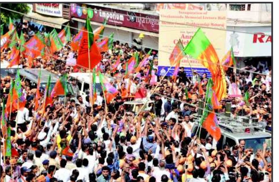
જંગ-એ-વડોદરા : પ્રધાનમંત્રી પદના ભાજપના ઉમેદવાર અને રાજ્યના મુખ્યમંત્રી નરેન્દ્ર મોદીએ પ્રથમ વખત લોકસભામાં ઉમેદવારી નોંધાવવા વડોદરા પહોંચ્યા ત્યારે પ્રજાએ ઉલ્લાસપૂર્વક શાનદાર સ્વાગત કર્યું હતું. ત્રણ કિલોમીટર લાંબા રોડ-શોમાં લાખો લોકો જયઘોષો સાથે નરેન્દ્ર મોદીનું અભિવાદન કર્યું હતું.

છે તેમાં નર્મદા, બનાસકાંઠા, જૂનાગઢ, પંચમહાલ, દાહોદ સહિત ૧૨ જેટલા જિલ્લાઓમાં છે. તેમણે જણાવ્યું હતું કે સમગ્ર તંત્ર ચૂંટણી માટે મિશન મોડમાં આવી ગયું છે. ચૂંટણી માટે નિયુક્ત કરાયેલા સામાન્ય નિરીક્ષકો પણ મતવિસ્તારોમાં તેમની ફરજ પર હાજર થઈ ગયા છે. રાજ્યમાં હાલ ૪,૦૫,૭૮,૫૭૭ મતદારો છે.