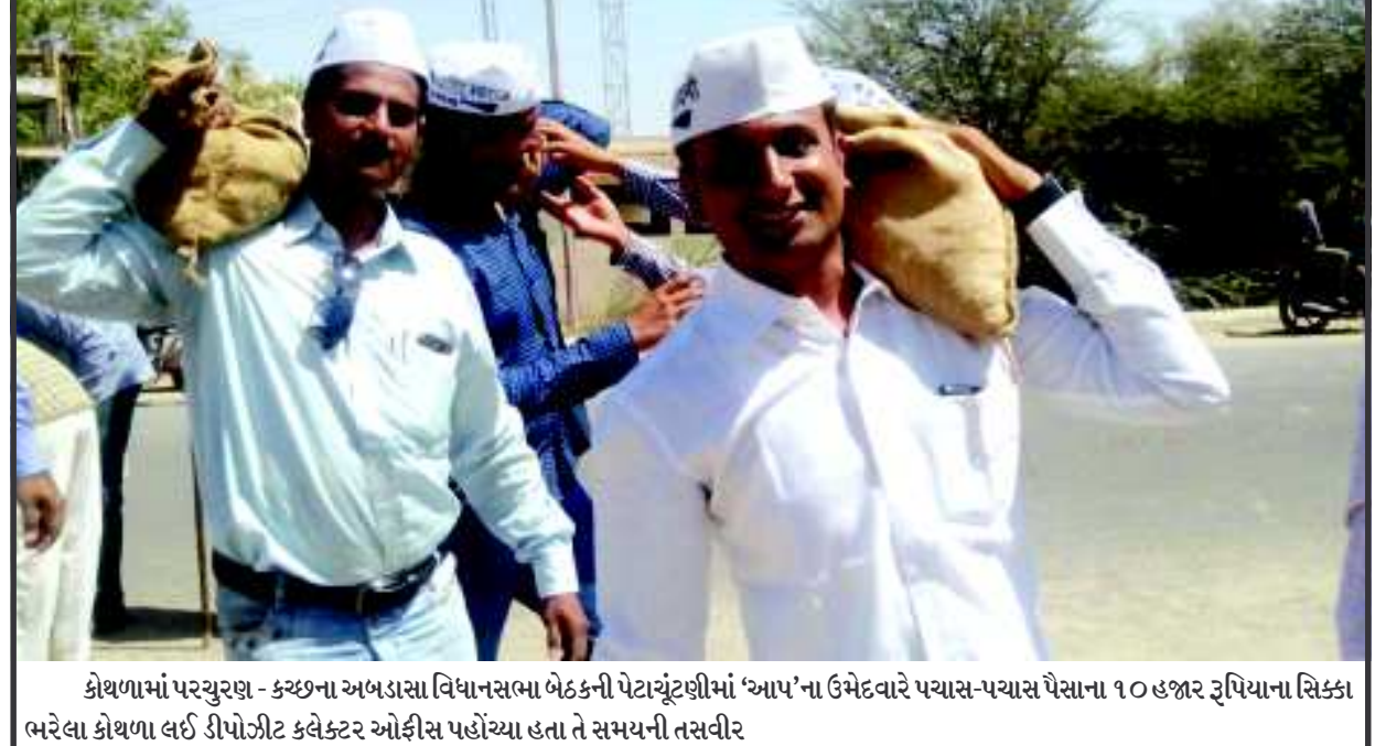
કોથળામાં પરચુરણ - કચ્છના અબડાસા વિધાનસભા બેઠકની પેટાચૂંટણીમાં 'આપ'ના ઉમેદવારે પચાસ-પચાસ પૈસાના ૧૦ હજાર રૂપિયાના સિક્કા ભરેલા કોથળા લઈ ડીપોઝીટ કલેક્ટર ઝોફીસ પહોંચ્યા હતા તે સમયની તસવીર