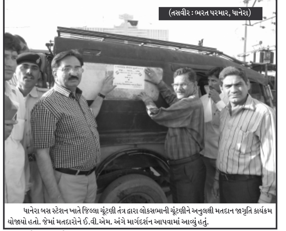
ધાનેરા બસ સ્ટેશન ખાતે જિલ્લા ચૂંટણી તંત્ર દ્વારા લોકસભાની ચૂંટણીને અનુલક્ષી મતદાન જાગૃતિ કાર્યક્રમ યોજાયો હતો. જેમાં મતદારોને ઈ.વી.એમ. અંગે માર્ગદર્શન આપવામાં આવ્યું હતું.