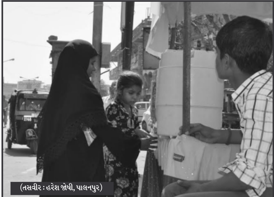
ચૈત્રી માસના આરંભે જ ઉનાળો જાણે ધીમે ધીમે આગમન કરી રહ્યો છે ત્યારે બનાસકાંઠાના પાલનપુરમાં ગુરુનાનક એકતા સદ્ભાવના ટ્રસ્ટ દ્વારા શહેરીજનો માટે દંડા મીનરલ પાણીની પરબ આજે શરૂ કરવામાં આવી છે. કાળજાળ ગરમીમાં આ પરબથી લોકોની તરસ ઈપાવતા રહિશોએ ખુશી વ્યક્ત કરી છે.

નભળો પ્રતિસાદ... ● અનુસંધાન પહેલાનું ચાલુ ઈમ્પેક્ટ ફીના મામલે અનુસંધાન છેલ્લાનું ચાલુ ફીના મામલે ન્યાય મેળવવા ઈચ્છતા સેક્ટરોના વેપારીઓ તેમજ વસાહતીઓની આજે સે-૧૭ સ્થિત બગીચામાં બેઠક યોજવામાં આવી હતી. આ દરમિયાન ૧૦૦થી વધુ વેપારી આગેવાનો ઉપસ્થિત રહ્યા હતા. બેઠક દરમિયાન અન્ય શહેરોની જેમ ગાંધીનગરમાં આ કાયદાનો યોગ્ય ઉપયોગ ન થતાં હોવાનો આકોશ વ્યક્ત કરી આ મામલે આગામી બે દિવસમાં મહેસુલ મંત્રીને રજૂઆત કરવાનો નિર્ણય લેવાયો હતો. જ્યારે મહેસુલ મંત્રીની સાથે બેઠક કર્યા બાદ પણ ન્યાય ન મળે તો આંદોલનની નવી નીતિ નક્કી કરી લડતનું અભિયાન હાથ ધરવામાં આવશે તેમ પણ વેપારી આગેવાનોએ જણાવ્યું છે.