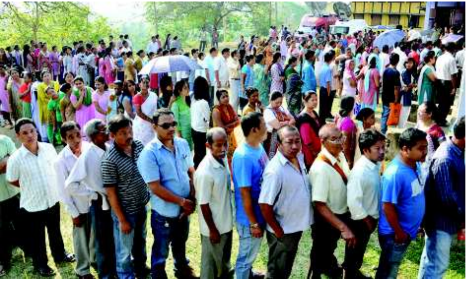
આપણું પોતાનું અખબાર

વોક્સભાની બેઠક માટે રેકોર્ડ ૮૧.૮ ટકા મતદાન થયું છે જ્યારે સિક્કિમમાં ૭૬ ટકા મતદાન થયું છે. ગોવાની બંને બેઠક અને આસામની ત્રણ બેઠકો ઉપર ૭૫ ટકાથી વધુ મતદાન થયું હતું. પ્રથમ ત્રણ તબક્કામાં રેકોર્ડ ઉંચું મતદાન થયા બાદ આજે વોક્સભાની ચૂંટણી માટે ચોથા તબક્કામાં શાંતિપૂર્ણ રીતે મતદાન શરૂ થયું હતું. ● અનુસંદાન પાન-૭ પર