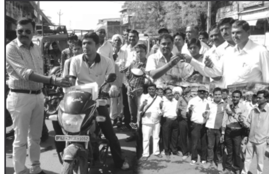
પાટણ જિલ્લા પોલીસ અને પત્રકારો દ્વારા મતદાન જાગૃતિ માટે આજે પાટણના બગવાડા દરવાજા ખાતે વાહન ચાલકોને ગુલાબનું ફૂલ આપી અવશ્ય મતદાન કરવા સંકલ્પ લેવાડાવવામાં આવ્યા હતા. આ કાર્યક્રમમાં મોટી સંખ્યામાં પોલીસ તંત્રના અધિકારીઓ કર્મચારીઓ અને પત્રકારો જોડાયા હતા. (ચેતન રામી, પાટણ)

પરીણામે આ પ્રવૃત્તિએ સુળીયા નાંબી દીધાં છે. આ પ્રવૃત્તિ ચાલવા પાછળ પોલીસને આર્થિક રીતે મોટો ફાયદો થતો હોવાનું ચર્ચાય છે. જેથી આ પ્રવૃત્તિ બંધ થાય તેમ પોલીસ ઈચ્છતી નથી તેવું પ્રજામાં બોલાય છે. શહેરમાં ક્રિકેટ સહાની સાથે વરલીમટકાં, પતાપાનાના જુગારની પ્રવૃત્તિ, દારૂ, છંડતી અનીતિધામ જેવી સમાજ વિરોધી પ્રવૃત્તિઓ પણ ચાલી રહી હોવાનું કહેવાય છે. આ ગેરકાયદે બંદીઓને સંપૂર્ણ નેસ્ત નાબૂદ કરવા પોલીસ દ્વારા પગલાં ન ભરાતાં ગુનાહિત પ્રવૃત્તિઓ વકરી જવા પામી છે. કહે છે કે, જૂના રીઠા સહોડીયાઓની સાથે નવા નિશાળીયાઓએ પણ આ ધંધામાં ઝપલાવ્યું છે. લોકોને આર્થિક રીતે બરબાદ અને પાયમાલ કરનારી આ ગેરકાયદે બંદી સામે પોલીસ સપ્લાઈથી કાનૂની રાહે પગલાં ભરે તેવું બુદ્ધિજીવી વર્ગના લોકો ઈચ્છે છે.