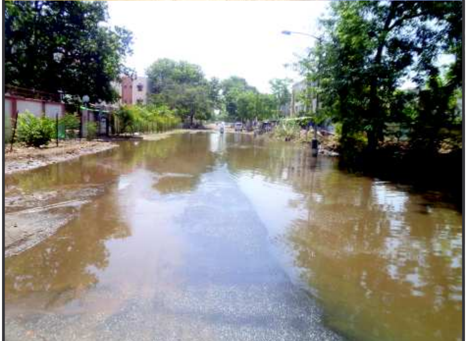
મૂશળધાર - રવિવારની સાંજે મૂશળધાર વરસાદ ખાબક્યો... દોઢ કલાકમાં તો ગાંધીનગરમાં જાણે જળબંબાકાર, નીચાણવાળા ભાગોમાં પાણી ભરાયા... ચોમાસાની યાદ અપાવતા હોય એવા પાણી ભરાયા... નગરના માર્ગો પર જાણે નદી વહેતી હોય એવા દૃશ્યો સર્જાયા... સોસાયટીના કોમન પ્લોટમાં જાણે તળાવ સર્જાયા હોય... આમ ઠેર ઠેર પાણી પાણી થઈ ગયું... દોઢ કલાકમાં સવા ઈય વરસાદ વરસ્યો અને નગરના જનજીવનને અસ્તવ્યસ્ત કરી દીધું.