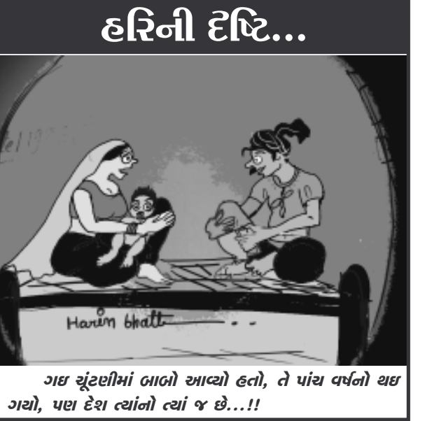
ગઈ ચૂંટણીમાં બાળો આવ્યો હતો, તે પાંચ વર્ષનો થઈ ગયો, પણ દેશ ત્યાંની ત્યાં જ છે...!!

અમદાવાદ, તા. ૨૩ દેશની ટોચની આઈઆઈટી અને એનઆઈટી કોલેજોમાં પ્રવેશ માટે સોન્ટ્રલ બોર્ડ ઓફ સોફ્ટવેર એન્જિનિયરિંગ દ્વારા જેઈઈ-એન્ટ્રન્સ એકઝામ મેઈન ૨૦૧૪ની પરીક્ષા લેવામાં આવી હતી. જેની આન્સર-કી આગામી ૨૫મી એપ્રિલે વેબસાઈટ પર મુકવામાં આવનાર છે. જેને વિદ્યાર્થીઓ પોતે પરીક્ષામાં આવનાર છે જેને વિદ્યાર્થીઓ પોતે પરીક્ષામાં લખેલા જવાબો સાથે સરખાવીને પોતાના પરીણામનું અનુમાન લગાવી શકશે જ્યારે પરીક્ષાનું પરીણામ ૨૩ મેના રોજ રજુ કરાશે. પ્રાપ્ત થતી માહિતી મુજબ દેશની ટોચની આઈઆઈટી અને ઈજનેરી સંસ્થાઓમાં પ્રવેશ માટે જેઈઈ-એન્ટ્રન્સ એકઝામ ફરજિયાત બનાવવામાં આવી છે. જે વાતને ધ્યાનમાં રાખી તાજેતરમાં સોન્ટ્રલ બોર્ડ ઓફ સોફ્ટવેર એન્જિનિયરિંગ દ્વારા જેઈઈ મેઈનની ઓફલાઈન અને ઓનલાઈન પરીક્ષા લેવામાં આવી હતી. સીબીએસઈની યાદીમાં જણાવ્યા મુજબ દેશભરમાંથી ૧૩ લાખ ૫૬ હજાર વિદ્યાર્થીઓએ જેઈઈ મેઈનની પરીક્ષા આપી હતી ત્યારે હવે સીબીએસઈ દ્વારા આ પરીક્ષાની આન્સર-કી વેબસાઈટ પર અપલોડ કરવાનો નિર્ણય કર્યો છે. જે અંતર્ગત આગામી ૨૫મી એપ્રિલે જેઈઈ મેઈન પરીક્ષાની આન્સર-કી સીબીએસઈ બોર્ડની વેબસાઈટ ઉપર મુકવામાં આવશે. ત્યારબાદ જેઈઈ મેઈન પરીક્ષાનું પરીણામ ૨૩ મેના રોજ રજુ કરવામાં આવશે. આ પરીક્ષાને આધારે દેશભરમાંથી દોઢ લાખ ટોચના લેવાતા વિદ્યાર્થીઓને જેઈઈ-એન્ટ્રન્સની પરીક્ષા આપવા માટે સિલિકેટ કરવામાં આવશે. જેઈઈ એન્ટ્રન્સની પરીક્ષા ૨૫મી મે ૨૦૧૪ના દિવસે લેવામાં આવશે જેનું પરીણામ ૧૯ જુને રજુ કરવામાં આવશે.