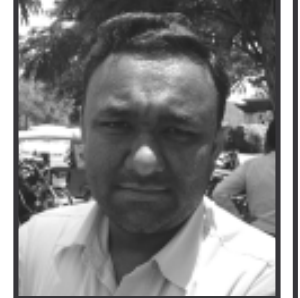
શિવાંગને ગાંધી વિચારમાં ગજબનો વિશ્વાસ છે તેથી તેઓ ગાંધી વિચારસરણીને મહત્વ આપી અનુસરતા ઉમેદવારને ચૂંટવા મત આપશે. ગાંધી વિચાર જ આ દેશની સાચી ઓળખ છે અને આ દેશને વધુ સક્ષમ, વધુ મજબૂત બનાવવાની એક માત્ર ચાવી છે તેવું તેમનું માનવું છે.