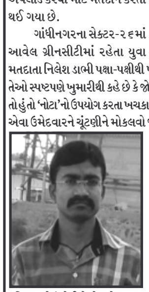
પરિબળ હોવું જોઈએ. દેશનો વડાપ્રધાન એક એવો વ્યક્તિ બનવો જોઈએ જે આંખે પાટા બાંધ્યા હોય છતાં સચ્ચાઈનું તાજતું તોલવા સક્ષમ હોય, તે ગમે તેવા ચમરબંધી અને સામાન્યમાં સામાન્ય માણસ વચ્ચે કોઈપણ ભેદભાવ રાખ્યા વગર સાચો ન્યાય તોળી શકે. નિવેશના મતે આ દેશના સરકારી પૈસા સામાન્ય જનતાની પરસેવાની કમાણીના છે જે કોઈ ખોટા ખર્ચા કે મોટા તાયફા કરવા માટે વેડફે તે તેમને હરગીઝ પસંદ નથી માટે જો કોઈ પણ વ્યક્તિ કે અપક્ષ ઉમેદવાર પણ તેમને આ બધી બાબતે યોગ્ય નહીં લાગે તો 'નોટા' બટનનો ઉપયોગ તેઓ અચૂક કરશે.