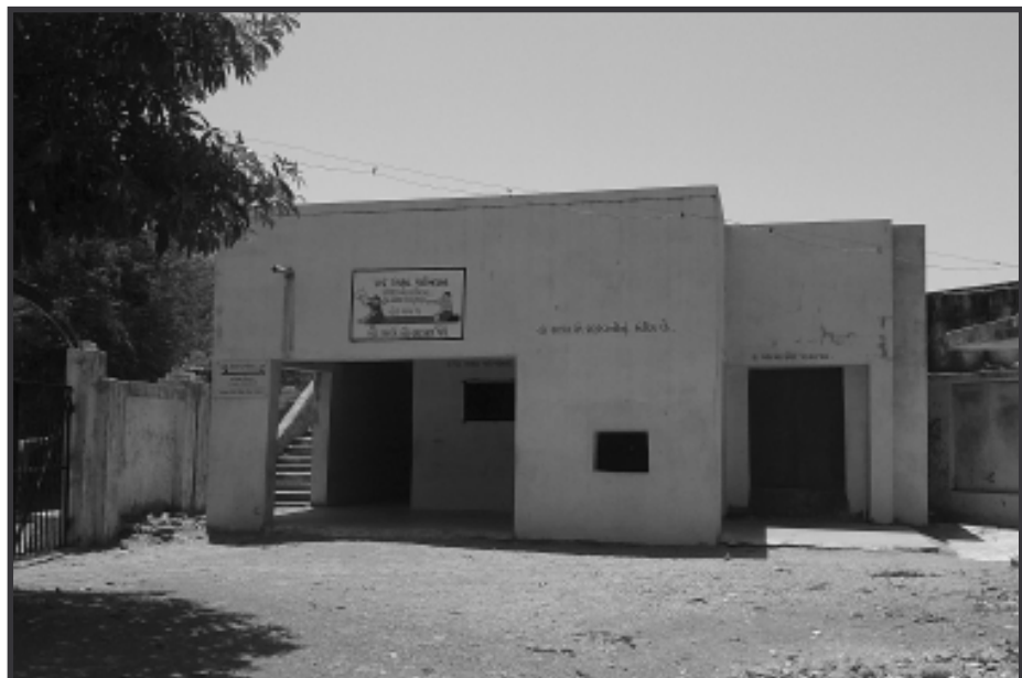
હેમખેમ પાર પાડવા વ્યસ્ત બનેલ છે તેવા સમયે ઉમરેઠ તાલુકાના ખાંભણપુરા ગામના પરા વિસ્તાર પાંચ મહુડીયા ગામની પ્રાથમિક શાળાને આ બનાવ કોઈ મોટુ સ્વરૂપ ધારણ કરે તે માટે તાલુકા તથા જિલ્લા કક્ષાના અધિકારીઓમાં દોડધામ મચી જવા પામી છે. હાલ ગ્રામજનોને સમજવાના આ સમગ્ર પ્રકરણ અંગે રૂબરૂ

જુના આચાર્ય પોતાની પત્ની અને પુત્રવધુનો ઉપયોગ કરી નવા આચાર્યને બદલામ કરવાની કોશીષ કરતા ગ્રામજનો આંદોલનના માર્ગે : પાંચ મહુડીયા પ્રા.શાળામાં જ.જ.કે ની ગ્રાંટનો હિસાક માંગતા મચેલી બબાલ : S.M.C. ના અધ્યક્ષ તથા સભ્યો અને ગ્રામજનોએ આચાર્યની બદલી ન થાય ત્યા સુધી શાળા ખુલવા ન દેવાના હઠાગ્રહ ઉપર : ચૂંટણીમાં પ્રત્યાઘાત ન પડે તે માટે સમગ્ર પ્રકરણ દબાવી દેવાનો ઉચ્ચ કક્ષાએથી શરૂ થયેલ પ્રયાસ : ટી.એમ.સી અને આચાર્યની મીલી ભગતથી ગ્રાંટની રકમમાં ભ્રષ્ટાચાર કર્યાની ચર્ચા