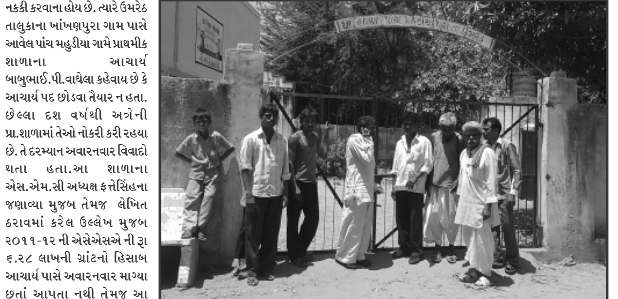
પરીપત્રના નીચમ મુજબ આચાર્યનું પદ મેળવવા પાત્ર થતાં જુના આચાર્ય પોતાનું પદ છોડવા તૈયાર ન હતા અને નવા શિક્ષક સામે પોતાની પત્ની અને સભ્યો તેમજ ગ્રામજનો નવા શિક્ષકની શિક્ષાત્મક કાર્યવાહી તેમજ તાકાલીક બદલી નહી તે અમર્યાદિત સમય સુધી તાળુબંધીનો કાર્યક્રમ અમલી કર્યાની માહિતી પ્રાપ્ત થયેલ છે.