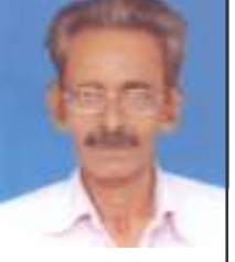
નરેન્દ્ર મોદીનો ચૂંટણી પ્રચારમાં વિક્રમ