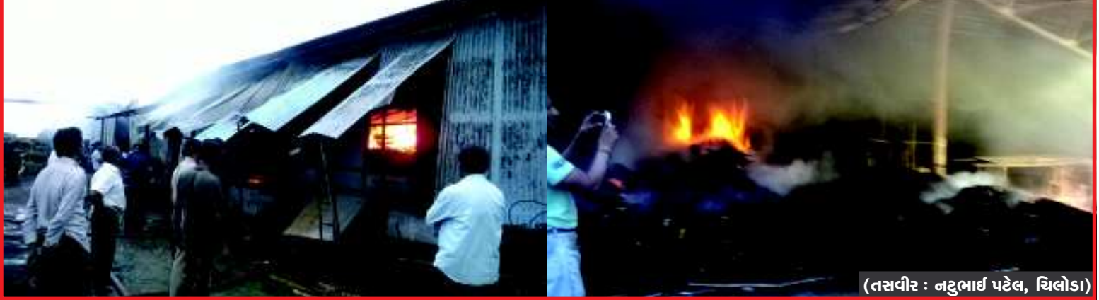
વિકરાળ બનેલી આગ પાંચ કલાક બાદ પણ બેકાબુ : ત્રણ-ત્રણ જિલ્લાની ફાયરબ્રિગેડ ઘટના સ્થળે