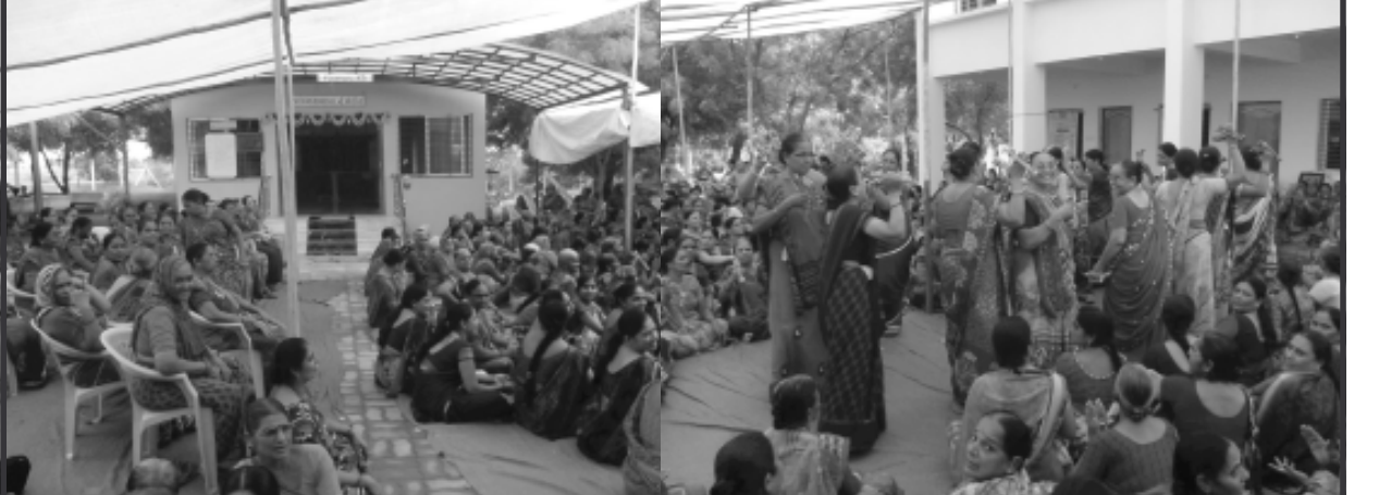
વડાગામે હિરાખાડીકંપા જલારામ સેવા સમિતિ દ્વારા બહેનો માટે શ્રાવણ માસ દરમિયાન ભજન કાર્યક્રમનું આયોજન કરવામાં આવ્યું હતું. આ ભજન કાર્યક્રમમાં મોટી સંખ્યામાં મહિલાઓ જોડાઈ હતી.