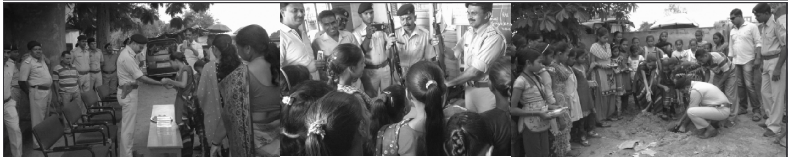
ગાંધીનગર તાલુકાના ચિલોડા ખાતે પોલીસ સ્ટેશન અને પ્રાથમિક શાળાના ઉપક્રમે રક્ષાબંધન તેમજ વૃક્ષારોપણનો કાર્યક્રમ યોજવામાં આવ્યો હતો. આ કાર્યક્રમ મહિલા સશક્તિકરણના ભાગરૂપે આયોજિત કરવામાં આવ્યો હતો. આ કાર્યક્રમમાં ચિલોડાની પ્રાથમિક શાળાની ૨૫ બાળાઓએ પી.આઈ. કે.એમ. પ્રિયદર્શી સહિત પોલીસ કર્મીઓના હાથે રાખડી બાંધી હતી. પોલીસ કર્મીઓ દ્વારા બાળાઓને કંપાસની ભેટ આપવામાં આવી હતી. આ ઉપરાંત આ બાળાઓને એફઆઈઆર, કોમ્પ્યુટર રૂમ વગેરેની સમજૂતિ આપી હથિયારોનું પ્રત્યક્ષ નિદર્શન કરાવવામાં આવ્યું હતું. આ ઉપરાંત પોલીસ કર્મીઓ અને બાળાઓ દ્વારા પોલીસ સ્ટેશનના પટાંગણમાં વૃક્ષારોપણ પણ કરવામાં આવ્યું હતું. આ પ્રસંગે પ્રાથમિક શાળાના શિક્ષણક ગણ પણ ઉપસ્થિત રહ્યા હતાં.