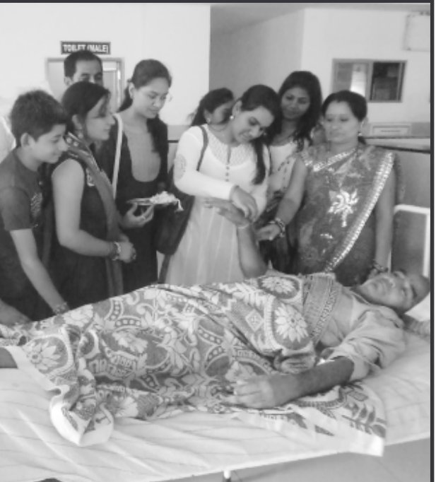
ઈન્ડિયન રેડ ક્રોસ સોસાયટી તથા સૌરાષ્ટ્ર કચ્છ સેવા સમાજ તરફથી રક્ષાબંધનના દિવસે સિવિલ હોસ્પિટલ ગાંધીનગર ખાતે દર્દીઓને રાખડી બાંધવામાં આવી હતી સાથે બીસ્કીટ અને ચોકલેટનું વિતરણ કરવામાં આવ્યું હતું.

● અનુસંધાન છેલ્લાનું ચાલુ સગા થાકીને એટલા દુસ્સ થઈ જાય કે વાત ના પૂછો. એમાંય જો વચ્ચે ઈમર્જન્સી કેસ આવી જાય એટલે એટલો સમય વધુ લાગે અને આ બધું પતાવ્યા પછી જ્યારે એક્સ-રે દર્દીના હાથમાં આવે એટલે ફરીથી પોતાના ઓપીડી ડૉક્ટરને બતાવવા જવાનું, જો એ હાજર હોય તો દર્દીનું સદ્ભાગ્ય. અને ડૉક્ટરને બતાવ્યા પછી ફરી દવા લેવાની લાઈનમાં તો ઉભું જ રહેવાનું. એટલે દર્દીએ એક્સ-રે પડાવવા માટે એક લાંબા માનસિક ત્રાસમાંથી ગુજરવું પડે ત્યારે તેની સારવાર શક્ય બને છે. આવી લાંબી લચ્ચક પ્રક્રિયાને કારણે તેમાં પણ હાલ સીઝનના કારણે દર્દીઓમાં વધારો થવાથી ખાસ કરીને એક્સ-રે વિભાગમાં રોજ બુમાબુમ અને તકરારનો માહોલ સર્જાય છે. લાઈનો સાચવવામાં સુરક્ષા સેવકો સાથે દર્દીઓ અને તેમના સગાઓની ઉગ્ર બોલાચાલી વારંવાર જોવા મળી રહે છે. આ મુશ્કેલી એક તો આટલી મોટી હોસ્પિટલમાં જ્યાં રોજના હજારો દર્દીઓ સારવાર લેવા આવે છે. ત્યાં માત્ર એક જ ડીપીટલ એક્સ-રે મશીન હોવાથી તેમજ તે વિભાગમાં નંબર નોંધવા, એક્સ-રે નો ચાર્જ ભરવા અને વળી પાછો કેસ પેપર પર સિક્કો મરાવવા અલગ અલગ બારીઓ પર દર્દીને રખડવું પડે છે. તેના કારણે સર્જાય છે. જો આ સમગ્ર પ્રક્રિયા એક જ બારીથી પતાવવામાં આવે તેમજ દર્દીઓનો ધસારો જોતા હજુ એકાદ મશીન વધારવામાં આવે તો દર્દીઓને હાલાકી ભોગવવામાંથી છુટકારો મળી શકે. તંત્ર દ્વારા આ બાબતે તાકીદે સુચારુ વ્યવસ્થા ગોઠવાય તે જરૂરી બની રહ્યું છે.