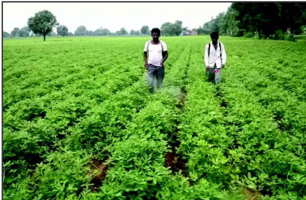
મેરે ટેશકી ધરતી - ભારત કૃષિપ્રધાન દેશ છે... એ વાત આપણી રગેરગમાં વહે છે... જ્યારે જ્યારે ભારતની ગ્રામ્ય સંસ્કૃતિ માણવાનું મન થાય ત્યારે ગામને ગોંદરે પાકથી લહેરાતા ખેતરોને નિહાળવાની એક મજા છે... આપણી સમય હોય તો એ કપાસના ખેતરો હોય કે ડાંગરના ખેતરો હોય અને વરસાદની મોસમ હોય તો એક અનોખી અનુભૂતિ થાય છે... ગાંધીનગરના ચિલોડા પંથકમાં પચાસ ટકા વરસાદ ખેડૂતોએ પાક વાવીને ખેતરોને લહેરાવી દીધા છે...

ગાંધીનગર, તા. ૧૨ ગાંધીનગરના સેક્ટરોમાં દાયકાઓથી અસ્તિત્વ ધરાવતા ભયજનક મકાનો આખરે તોડી પાડવામાં આવશે. વિવિધ સેક્ટરોમાં સ્થિત જુદી જુદી કક્ષાના ૧૭૦૦ જેટલા નિકાલ હેઠળના મકાનો તોડી નંખવા વિભાગ દ્વારા મંજૂરી આપી દેવાતા ટુંકમાં કામગીરી હાથ ધરાશે. આ મકાનો વાંબા સમયથી ખાલી હાલતમાં છે. પરંતુ આ મકાનો નિકાલ હેઠળના જાહેર કરાયા બાદ આવાસોનો નિકાલ કરવાના મામલે વાંબા સમયથી કોઈ નીતિ નક્કી ન થતા જોખમી આવાસો તંત્રના અધિકારીઓ માટે પણ લટકતી તલવાર સમાન બન્યા હતા. શહેરના સેક્ટરોમાં કુલ ૧૮૦૪ મકાનો નિકાલ હેઠળની યાદીમાં સામેલ હતા. આ પૈકી સ્વર્ણિમ પાર્કની કામગીરી દરમિયાન અગાઉ સે. ૧૬ ના ૬૦ મકાનો તોડી પાડવામાં આવ્યા હતા. જ્યારે સે. ૧૩ માં પણ જ-કક્ષાના ૧૪૪ મકાનો તોડવાનું કામ હાથ ધરાયું હતું. જેના અંતે હાલની સ્થિતિએ અંદાજે ૧૭૦ જેટલા નિકાલ હેઠળના મકાનો હજી પણ સેક્ટરોમાં જોખમી હાલતમાં છે. આ નિકાલ હેઠળના મકાનો અંગે નીતિ વિષયક નિર્ણય લેવા અગાઉ મુખ્યમંત્રી સમક્ષ તંત્રના ઉચ્ચ અધિકારીઓ દ્વારા પ્રેઝન્ટેશન પણ કરવામાં આવ્યું હતું. પ્રેઝન્ટેશન અને બેઠકોના દૈરના અંતે આ મકાનો આખરે તોડી પાડવાનો નિર્ણય લેવામાં આવ્યો છે. થોડા દિવસો પૂર્વે ઉચ્ચકક્ષાએ યોજાયેલી બેઠકના અંતે શહેરમાં નિકાલ હેઠળના તમામ મકાનો દૂર કરવાની વાતને લીધી ઝંડી આપી દેવાઈ છે. હાલની સ્થિતિએ સે. ૨૦માં ૬૦ મકાનો, સે. ૬ માં ૭૮, સે. ૭માં ૬૩૬, સે. ૧૩માં ૩૨૨, સે. ૧૬માં ૮૪, સે. ૨૦માં ૨૮૦, સે. ૨૮માં ૨૪૦ મકાનો નિકાલ હેઠળના છે. આ તમામ મકાનો તોડી નંખવામાં આવશે. ટુંકમાં જ જોખમી આવાસો તોડવાનું કામ શરૂ કરી દેવાશે. નિકાલ હેઠળના આવાસો તોડી તેના ઠેકાણે ટાવર કેમ્પસનું નિર્માણ કરવા પણ ગતિવિધિઓ હાથ ધરવામાં આવી છે.