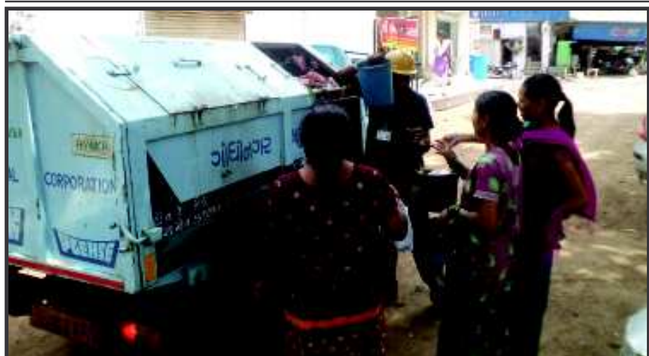
ડોર-ટુ-ડોર કલેક્શન - ગાંધીનગરમાં સફાઈ અભિયાન અન્વયે મહાનગરપાલિકા દ્વારા છેલ્લા એક મહિનાથી ટોર-ટુ-ડોર કચરાનું કલેક્શન શરૂ કરાયું છે... નવા સેક્ટરોમાં સમગ્ર વ્યવસ્થાને પ્રોત્સાહક પ્રતિસાદ સંપડી રહ્યો છે... સમગ્ર શહેરમાં જો વ્યવસ્થા સ્વીકૃત બનશે તો સ્વચ્છ ગાંધીનગરના સ્વપ્રને સાકાર કરવામાં સરળતા ઉભી થશે... નગરજનો પણ આ અભિયાનમાં સહયોગ આપી રહ્યા છે...