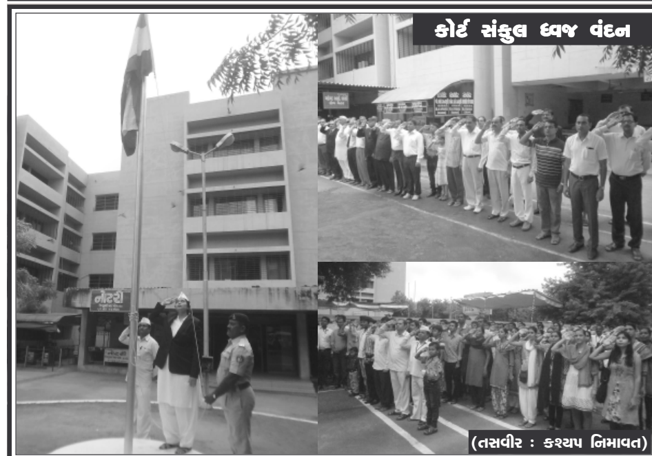
કોર્ટ સંકુલ ધ્વજ વંદન