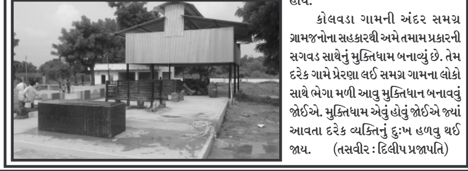
કોલવડા ગામની અંદર સમગ્ર ગ્રામજનોના સહકારથી અમે તમામ પ્રકારની સગવડ સાથેનું મુક્તિધામ બનાવ્યું છે. તેમ દરેક ગામે પ્રેરણા લઈ સમગ્ર ગામના લોકો સાથે ભેગા મળી આવું મુક્તિધામ બનાવવું જોઈએ. મુક્તિધામ એવું હોવું જોઈએ જ્યાં આવતા દરેક વ્યક્તિનું દુઃખ હળવું થઈ જાય.