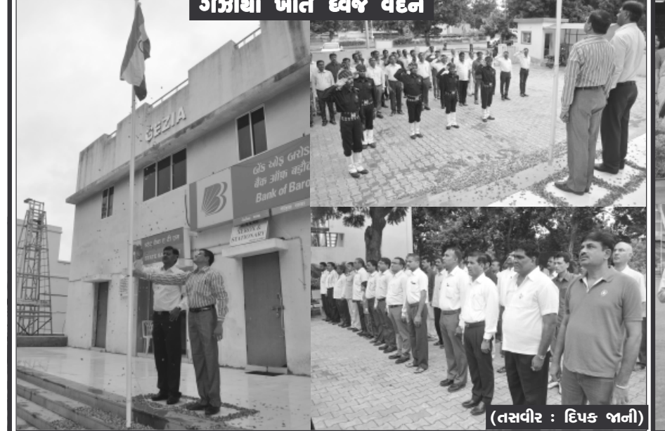
ગોગીયા ખાતે ધ્વજ વંદન