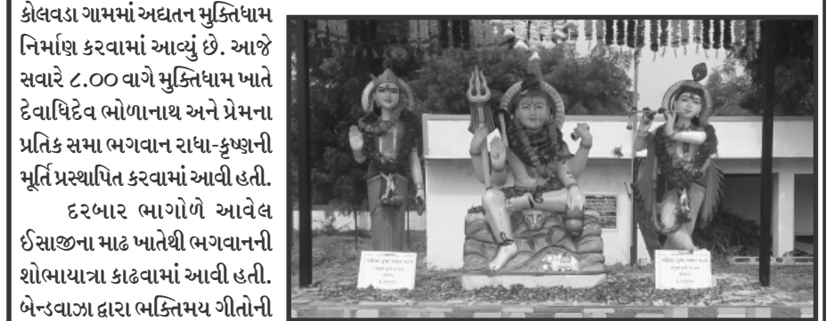
કોલવડા ગામમાં અઘતન મુક્તિધામ નિર્માણ કરવામાં આવ્યું છે.

રાજ્યમાં પ્રથમ સિદ્ધપુર બાદ બીજા નંબરનું મુક્તિધામ જ્યાં મૃતદેહને અગ્નિસંસ્કાર પહેલા સ્નાન કરાવવામાં આવશે ગાંધીનગર, તા. ૧૮ કોલવડા ગામમાં અઘતન અંતિમધામનું નિર્માણ કરવામાં આવ્યું છે. નવનિર્મિત મુક્તિધામમાં ભગવાન શંકર અને રાધા-કૃષ્ણની મૂર્તિ આજે વાજતે-ગાજતે શોભાયાત્રા કાઢી પ્રસ્થાપિત કરવામાં આવી હતી. મોટી સંખ્યામાં ગ્રામજનો ઉપસ્થિત રહ્યા હતા. સમગ્ર કોલવડા ગામના સાથ અને સહકારથી રૂપિયા પંદર લાખના ખર્ચે મુક્તિધામ નિર્માણ પામ્યું છે. મુક્તિધામ એટલે અંતિમ વિસામાં જ્યા દરેક વ્યક્તિને જવાનું હોય છે. ત્યારે નગરની પાસે આવેલ કોલવડા ગામમાં અઘતન મુક્તિધામ નિર્માણ કરવામાં આવ્યું છે. આજે સવારે ૮.૦૦ વાગે મુક્તિધામ ખાતે દેવાધિદેવ ભોળાનાથ અને પ્રેમના પ્રતિક સમા ભગવાન રાધા-કૃષ્ણની મૂર્તિ પ્રસ્થાપિત કરવામાં આવી હતી. દરબાર ભાગોળે આવેલ ઈસાજાના માઠ ખાતેથી ભગવાનની શોભાયાત્રા કાઢવામાં આવી હતી. બેન્ડવાજા દ્વારા ભક્તિમય ગીતોની રમઝટ બોલાવવામાં આવી હતી. ત્યારે સૌ ગ્રામજનો ભક્તિમાં લીન બની ગયા હતા. આ પ્રસંગે બહુચર મંડળ અને કોલવડા મહિલા મંડળ દ્વારા ભજન સલ્લંગનો કાર્યક્રમ યોજવામાં આવ્યો હતો. ત્યારબાદ સત્યનારાયણ ભગવાનની કથા યોજાઈ હતી. અઘતન મુક્તિધામ ગામમાં રહેતા દરેક સમાજના સાથ-સહકારથી પંદર લાખના ખર્ચે નિર્માણ પામ્યું છે. જેમાં પોતાના સ્વજનોને અંતિમ વિદાય