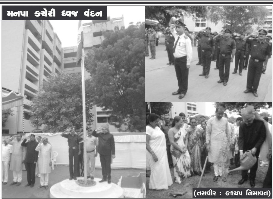
મનપા કચેરી ધ્વજ વંદન (તસવીર : કશ્યા નિખાવત)