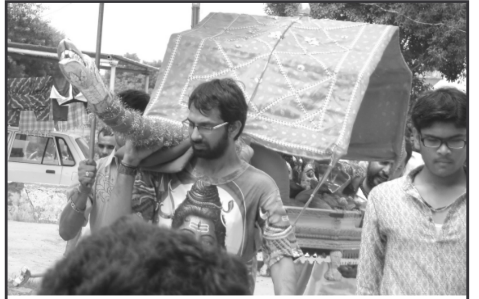
પ્રાંતિજ ખાતે આવેલ શ્રી માર્કેટશ્વર મહાદેવની જન્મષ્ટમીના પર્વે વાજતે ગાજતે ઢોલનગરા સાથે પાલખી નિકળી હતી. જેમાં મોટી સંખ્યામાં ભાવિકો જોડાયા હતા.