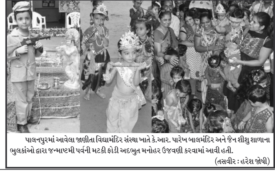
પાલનપુરમાં આવેલા જાણીતા વિદ્યામંદિર સંસ્થા ખાતે કે.આર. પારેખ બાલમંદિર અને જૈન શીશુ શાળાના ભુલકાંઓ દ્વારા જન્મષ્ટમી પર્વની મટકી ફોડી અદભુત મનોહર ઉજવણી કરવામાં આવી હતી.