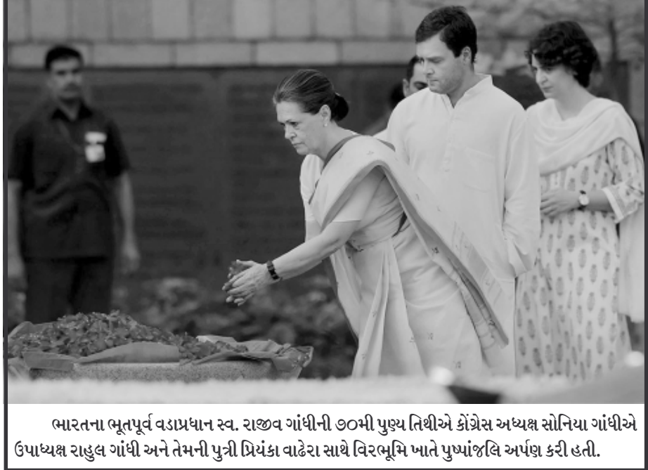
ભારતના ભૂતપૂર્વ વડાપ્રધાન સ્વ. રાજીવ ગાંધીની ૭૦મી પુણ્ય તિથીએ કોંગ્રેસ અધ્યક્ષ સોનિયા ગાંધીએ ઉપાધ્યક્ષ રાહુલ ગાંધી અને તેમની પુત્રી પ્રિયંકા વાઢેરા સાથે વિરભૂમિ ખાતે પુષ્પાંજલિ અર્પણ કરી હતી.

આ સમીકરણતથી નારાજ છે. પ્રદેશની ગતિવિધી પર નજર રાખનાર લોકો માને છે કે માત્ર ત્રણ મહિના પહેલા જ ભાજપ જોરદાર બહુમતિ સાથે સત્તામાં આવ્યો છે. મોદીના નેતૃત્વમાં લોકોએ વિશ્વાસ દર્શાવ્યો હતો. લોકો માની રહ્યા છે કે મોદી શ્રેષ્ઠ નેતા તરીકે ઉભરી રહ્યા છે. મોદીએ લોકોમાં નવી આશા જગાવી છે. કારણ કે શિસ્ત અને ગવર્નર્સ પર તેઓ ધ્યાન આપી રહ્યા છે. આગામી વર્ષે બિહારમાં વિધાનસભાની ચૂંટણી યોજનાર છે જેથી ભાજપ વધુ તાકાત સાથે આ ચૂંટણીની તૈયારીમાં છે. બિહારમાં વિધાનસભાની ૨૪૩ બેઠકો પૈકી ૧૭૨ બેઠકો જીતવા માટેની તૈયારી ભાજપે હાથ ધરી છે. કેન્દ્રમાં નરેન્દ્ર મોદી વડાપ્રધાન બન્યા બાદ ભાજપનો નૈતિક જુસ્સો અનેક ગણો વધી ગયો છે. ભાજપ વિરોધી તમામ પક્ષો હવે બિહારમાં