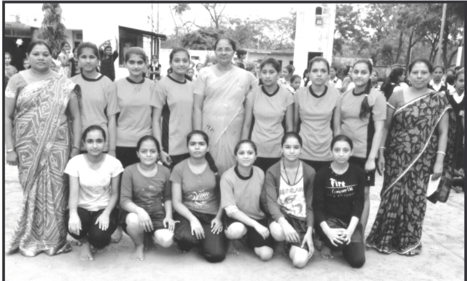
અંડર-૧૭ કબડ્ડી સ્પર્ધામાં વિજેતા જિલ્લાકક્ષાની અંડર-૧૭ કબડ્ડી સ્પર્ધા મહાત્મા ગાંધી વિદ્યાલય સેક્ટર-૧૬ ખાતે યોજાઈ હતી. સ્પર્ધામાં શ્રી જે.એમ. ચૌધરી કન્યા વિદ્યાલય, સે. ૩ વિદ્યાર્થીનીઓની ટીમે પ્રથમ નંબર મેળવ્યો છે. શાળાના આચાર્યા અને શાળા પરિવાર દ્વારા અભિનંદન પાઠવવામાં આવ્યા છે.