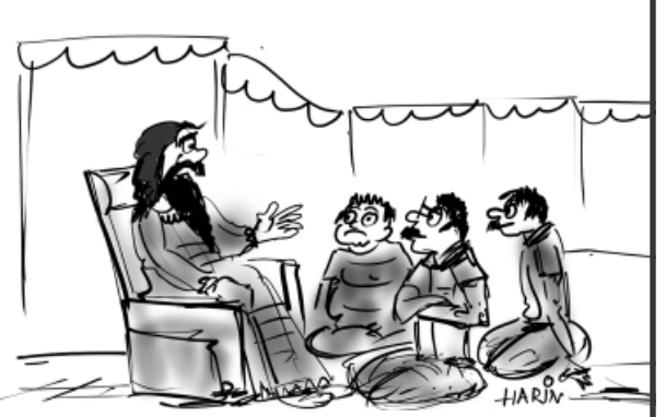
વત્સ, આ દુનિયામાં બે જ પ્રકારનાં માણસો છે, એક પોતે કંટાળો છે અને બીજા પ્રકાર એ છે કે તે બીજા લોકોને કંટાળો આપે છે...!!