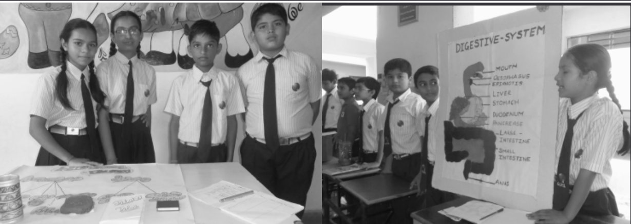
ગાંધીનગર ઈન્ટરનેશનલ પબ્લિક શાળામાં સમૂહ એકઠાઈબિશન યોજવામાં આવ્યું હતું. જેમાં વિદ્યાર્થીઓએ શિક્ષકોના માર્ગદર્શન હેઠળ સામાજિક વિજ્ઞાન, ગણિતશાસ્ત્ર, વિજ્ઞાનશાસ્ત્ર, આર્ટ, ફેશ્યન, ડીઝાઇન પોતાની શૈલીમાં બનાવી. એકઠાઈબિશનમાં રજૂ કરી હતી. એકઠાઈબિશનમાં રજૂ કરવામાં આવેલી શ્રેષ્ઠ કૃતિઓને પ્રથમ, દ્વિતીય અને તૃતીય નંબર આપી સન્માનિત કરવામાં આવ્યા હતા.