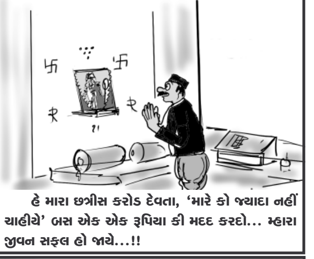
હે મારા છત્રીસ કરોડ દેવતા, 'મારે કો જવાદા નહીં ચાહીયે' બસ એક એક રૂપિયા કી મદદ કરદો... મહારા જીવન સફલ હો જાયે...!!