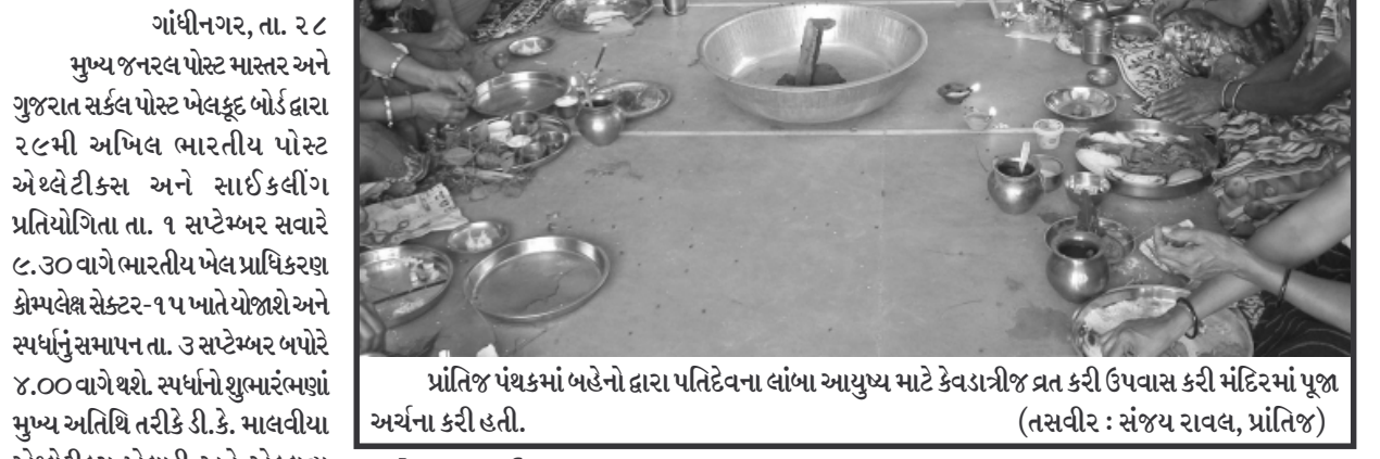
પ્રાંતિય પંથકમાં બહેનો દ્વારા પતિદેવના લાંબા આયુષ્ય માટે કેવડાની જ પ્રત કરી ઉપવાસ કરી મંદિરમાં પૂજા અર્ચના કરી હતી.

કારણે સરકારી યોજનાઓના હક્કના નાણા સીધા તેમના બચત ખાતામાં જમા થશે ઉપરાંત મોડાસા શહેરની વિવિધ બેંકો દ્વારા મફત બચત ખાતા ખોલવા માટે સ્વોલ ઉભા કરવામાં આવ્યા હતા. કાર્યક્રમમાં જિલ્લા કલેક્ટર બી. જે. ભટ્ટ સહિત વિવિધ બેંકોના અધિકારીઓ તેમજ મોડાસા શહેરના આગેવાનો ઉપસ્થિત રહ્યા હતા.