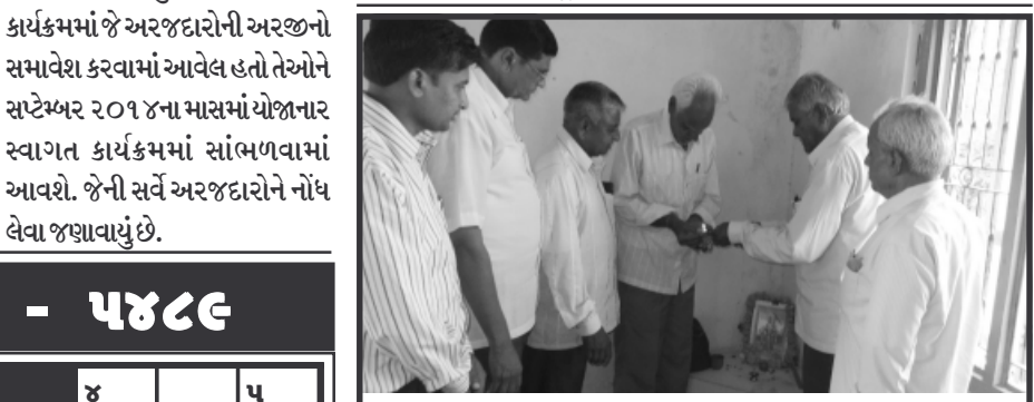
પ્રાંતિય માર્કેટ ચાર્જ ખાતે તાલુકા કિસાન સંઘ દ્વારા ખેતી વિષયક જ્ઞાનલા શિર્ષક હેઠળ શિક્ષણ વર્ગ યોજાયો હતો. જેમાં મોટી સંખ્યામાં કિસાન સંઘના સભ્યો હાજર રહ્યા હતા અને કિસાનોને ખેતી વિષયક માર્ગદર્શન અને માહિતી આપી હતી.