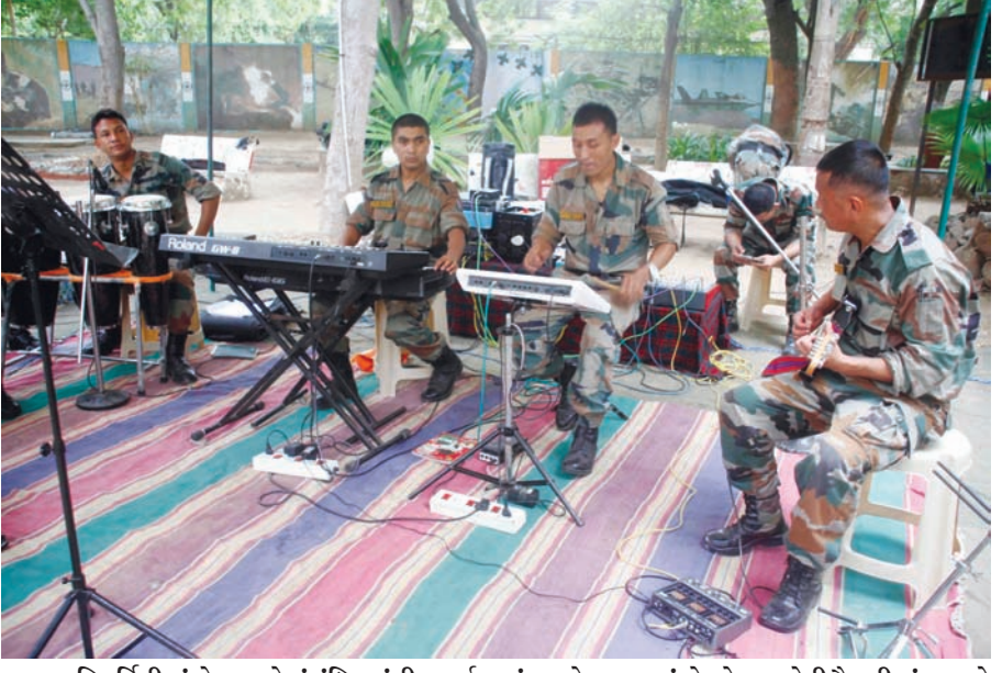
યુનિવર્સિટીમાં સેના સાથે સંબંધિત સંગીત કાર્યક્રમનું આયોજન કરાયું છે, જેના માટેની તૈયારીમાં જવાનો લાગી ગયા છે.

અભ્યાસક્રમ ચલાવતી ૨૧ કોલેજોને તો એક પણ વિદ્યાર્થી મળ્યો નથી. જેના કારણે આવી કોલેજોને તાળા મારવા પડે તેવી સ્થિતિ જોવા મળી રહી છે. છેલ્લા કેટલાક સમયથી રાજ્યમાં ઈજનેરી સહિતના ટેકનિકલ અને મેનેજમેન્ટના અભ્યાસક્રમોના વળતા પાણી જોવા મળી રહ્યા છે. આડેપડ બાનગી કોલેજોને મંજૂરી જેવા કારણોસર રોજગારીની તકો ઘટતા વિદ્યાર્થીઓ અન્ય અભ્યાસક્રમો તરફ વળ્યા છે. જેના કારણે મોટાભાગની બેઠકો ખાલી રહી છે.