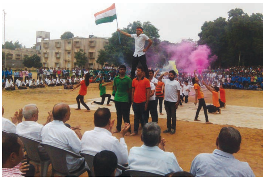
દેશમાં ધામધૂમપૂર્વક મનાવવામાં આવે છે. અરવલ્લી જિલ્લાના દેશભક્તિના રંગે રંગાયુ

મોડાસા, તા. ૧૬ ભારત દેશને સ્વતંત્ર થયાના ૬૯મા સ્વાતંત્ર્ય દિનની ઉજવણી