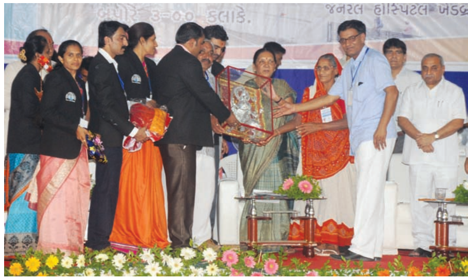
યોજાયે હતો. મુખ્યમંત્રી આનંદીબેન પટેલના હસ્તે સિવિલ હોસ્પિટલના પેકી ૧૦ આદિવાસીઓને સનદો મુખ્યમંત્રીના હસ્તે આપવામાં સુવિધાઓવાયુ રૂ. ૮ કરોડના ખર્ચે બનાવવામાં આવેલ સિવિલ

ખેડબ્રહ્મા, તા. ૧૬ ખેડબ્રહ્મામાં બનાવવામાં આવેલ નવીન સિવિલ હોસ્પિટલના મકાનનો રવિવારે લોકાર્પણ કાર્યક્રમ