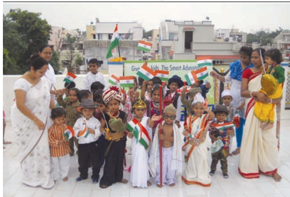
સેક્ટર-૪બીમાં આવેલ સ્માર્ટ કિડ્ઝ સ્કૂલ ખાતે ૬૮માં સ્વાતંત્ર્ય દિનની ઉજવણી ઉત્સાહભરે તથા ધામધૂમથી કરવામાં આવી હતી. જેમાં નાના ભૂલકાઓની વેશભૂષા એ પૂબ જ આકર્ષણ જમાવ્યું હતું.