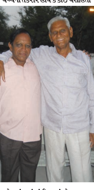
ઘરે પ્રસંગમાં કાંઈ ખૂટ્યું હોય તમામ બનાબભા મિલાવી તંત્રને ટકકર

આરોગ્ય-પડોશના વસાહતીઓને બંને પર એટલો વિશ્વાસ કે ઘરના અંગત ઝઘડામાં પણ મધ્યસ્થી માટે તેમને બોલાવવા લાગ્યા. પાડોશીઓ વચ્ચેની તકરાર હોય કે કોઈ વસાહતી