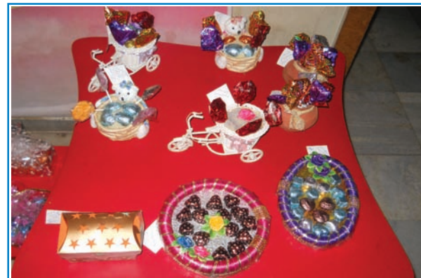
ગાંધીનગરનાં સર્જનાત્મક નાગરિકો પૈકી મહિલાઓના એક જૂથે હોમ મેડ ચોકલેટ્સનું પ્રદર્શન સહ વેચાણ સેક્ટર-૪ ખાતે રવિવારે યોજાયું હતું. કેમિકલ, સેકેન્ડ ક્રીકેટ રંગ રહિત આ ચોકલેટ્સ અલગ-અલગ સ્વાદમાં તૈયાર કરવામાં આવી હતી. સ્વાભાવિક રીતે જ ચોકલેટ વિષયના આ પ્રદર્શનને બહોળો પ્રતિસાદ મળ્યો હતો.

પત્રકારત્વના વિદ્યાર્થીઓએ ચેરમેન વલ્લભભાઈ પટેલને સ્મૃતિ-ચિહ્ન તરીકે બે પુસ્તકો અને એક કોમ્પેક્ટ ડિસ્ક ભેટમાં આપી હતી.