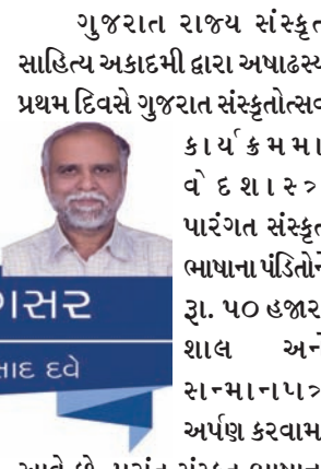
પ્રસંગર ભાગ્યુભસાદ દવે

ગુજરાત રાજ્ય સંસ્કૃત સાહિત્ય અકાદમી દ્વારા અષાઢસ્ય પ્રથમ દિવસે ગુજરાત સંસ્કૃતોત્સવ કાર્યક્રમમાં વેદશાસ્ત્ર પારંગત સંસ્કૃત ભાષાના પંડિતોને રૂા. ૫૦ હજાર, શાલ અને રામાના પાત્ર અર્પણ કરવામાં આવ્યા છે.