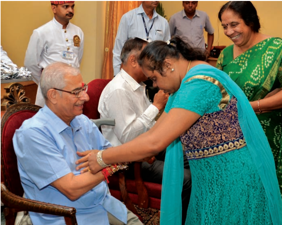
રક્ષાબંધન - ગાંધીનગરમાં રક્ષાબંધનનું પર્વ ધામધૂમથી ઉજવવામાં આવ્યું હતું. ગાંધીનગરના નાગરિકોની સાથે સાથે રાજકીય આગેવાનો પણ આજના આ પર્વમાં ઉત્સાહપૂર્વક જોડાયા હતા. ગાંધીનગર રાજભવન ખાતે ગુજરાત રાજ્યના રાજ્યપાલશ્રી ઓ.પી. ક્રોહલીને ગાંધીનગર-અમદાવાદ સ્થિત મંદબુદ્ધિના બાળકોની શાળાના બાળકોએ રક્ષાબંધન કર્યું હતું. આ પ્રસંગે રાજ્યપાલશ્રી હર્ષોલ્લાસ વ્યક્ત કર્યો હતો.