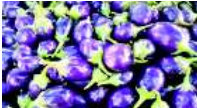
આસમાને પહોંચેલા શાકભાજીના ભાવમાં કડાકો નોંધાયો છે. છેલ્લા ચાર-પાંચ મહિનાથી