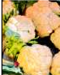
શાકભાજીના ભાવો ખુબ ઉંચા જોવા મળ્યા હતા. ભાવો ખુબ વધી જતા ગૃહિણીઓને ફળ અને શાકભાજીના બજેટમાં કપાત કરવાની ફરજ પડી હતી. હવે શિયાળુ પાકની બજારોમાં ભરપુર આવક થતા ભાવો ઘટી રહ્યા છે. સરેરાશ દરેક શાકભાજીમાં કિલોએ રૂ. ૧૦ થી ૩૦નો ઘટાડો જોવા મળી રહ્યો છે. ઉંધીયાની સિંજાન આવતા જ ભાવો ઘટતા ગૃહિણીઓ ઉત્સાહમાં આવી ગઈ છે. કુલાવર, વટાણા, રીંગણ, કોબી, દૂધી જેવી શાકભાજીના ભાવો નીચા ઉતર્યા છે તો શિયાળાની સ્પેશીયાલીટી ગણાતી મેથી, પાલક, સુવા, કોથમીર જેવી ભાજીઓ ખુબ ઓછા ભાવે બજારોમાં ઉપલબ્ધ