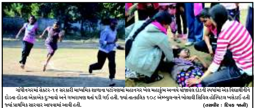
ગાંધીનગરમાં સેક્ટર-૧૬ સરકારી માધ્યમિક શાળાના પટોંગણમાં મહાનગર ખેલ મહાકુંભ અન્વયે યોજાઈ રહેલા દોડની સ્પર્ધામાં એક વિદ્યાર્થીનીને દોડતા-દોડતા એકાએક ઘુબાવે અને ગભરામણ થતાં પડી ગઈ હતી. જ્યાં તાત્કાલિક ૧૦૮ એમ્બ્યુલન્સને બોલાવી સિવિલ હોસ્પિટલ ખસેડાઈ હતી જ્યાં પ્રાથમિક સારવાર આપવામાં આવી હતી.

ગાંધીનગર, તા. ૩ પાંચ હજારથી વધુ વસ્તી ધરાવતી ગ્રામ પંચાયતોના દફતર ચકાસણી કાર્યક્રમમાં તંત્રના અધિકારીઓની ઉદાસીનતા સામે જિલ્લા વિકાસ અધિકારીશ્રી વિક્ટર મેકવાને નારાજગી વ્યક્ત કરી હતી. ગાંધીનગર જિલ્લાના ૪૮ જેટલા ગામોની દફતર ચકાસણી માટે ૪ જેટલા અધિકારીઓની ટીમો બનાવવામાં આવી હતી. દિવાળી પહેલાં આ કામગીરી માટેના આદેશો મળ્યા હતા. મળતી વિગતો મુજબ ૫૦ ટકા જેટલી કામગીરી આ માસ પૂર્વે સંપન્ન કરવાનો લક્ષ્યાંક રાખવામાં આવ્યો હતો પરંતુ હજુ સુધી માત્ર ૩ જ ગામોના દફતરની ચકાસણી અંગેનો અહેવાલ જિલ્લા વિકાસ અધિકારી સમક્ષ રજૂ થયો છે. જિલ્લા વિકાસ અધિકારીશ્રી મેકવાને આ કામગીરીથી નારાજ થઈ જવાબદાર અધિકારીઓને કડક તાકીદ લેખિતમાં કરતાં તંત્રમાં સમગ્ર ગામોના દફતરની ચકાસણી અંગેનો