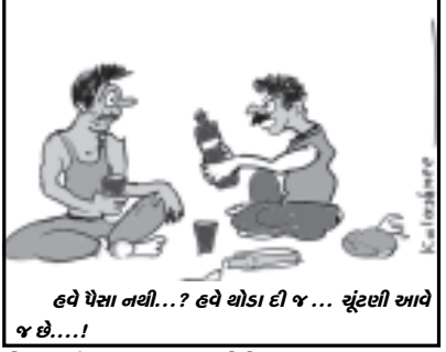
હવે પેસા નથી...? હવે યોડા દી જ... ચૂંટણી આવે જ છે...!