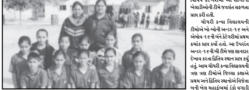
રમતમાં ઉત્કૃષ્ટ પ્રદર્શન કરી વિવિધ કેટેગરીમાં પ્રથમ અને દ્વિતીય સ્થાન પ્રાપ્ત કરી શાળાનો ડંકો વગાડી દીધો હતો. તાજેતરમાં ચાલી રહેલ રાજ્ય સરકાર આયોજિત ખેલ મહાકુંભ

જિલ્લા કક્ષાએ અન્ડર-૧૬ અને એબોવ-૧૬ની ટીમો પ્રથમ સ્થાને તેમજ અન્ડર-૧૬ની બી ટીમ દ્વિતીય સ્થાને વિજેતા બની ગાંધીનગર, તા. ૧૦ અત્યારે રાજ્યભરમાં ધૂમ મચાવી રહ્યો છે. રાજ્યની ખેલ પ્રતિભાઓને યોગ્ય તક મળે તો અનેક ટીમોએ ખેલ મહાકુંભમાં ખોખોની આંતરરાષ્ટ્રીય સ્તરના ખેલાડી રત્નો