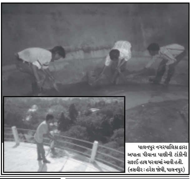
પાલનપુર નગરપાલિકા દ્વારા અપાતા પીવાના પાણીની ટાંકીની સફાઈ હાથ ધરવામાં આવી હતી.