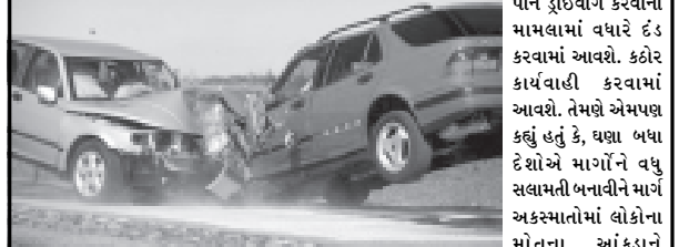
ઓસ્કાર ફર્નાન્ડીએ માર્ગ અકસ્માતોમાં મોતને ૫૦ ટકા સુધી ઘટાડવાની રણનીતિ ઘડી કાઢી છે. વર્લ્ડ હેલ્થ ઓગેનાઈઝેશન અને વર્લ્ડ બેંક દ્વારા આયોજિત એક કાર્યક્રમમાં બોલતા રાષ્ટ્રીય પાટનગર દિલ્હીમાં ફર્નાન્ડીએ કહ્યું હતું કે, મંત્રાલય દ્વારા ટૂંક સમયમાં જ એવા ધારાધરોહી જારી કરવામાં આવશે જેના ભાગરૂપે બેદરકારીનો પણ શિકાર બને છે. પ્રધાને કહ્યું હતું કે, દેશમાં હાલમાં ઘણા બધા માર્ગોને વધુ સુરક્ષિત બનાવવામાં આવશે. ઉપરાંત મોટર વ્હીકલ એક્ટમાં સુધારા કરવામાં આવશે. આ સુધારાના

બેદરકારી મામલામાં દંડ અને સજા વધારાશે : ટ્રાફિકના નિયમોના ભંગના મામલામાં કઠોર કાર્યવાહી પણ કરાશે : મોટર વ્હીકલ એક્ટમાં સુધારા હાથ ધરાશે નવી દિલ્હી, તા. ૧૪ ભાગરૂપે ટ્રાફિક ધારાધરોહીના ભંગ બદલ દંડ અને માર્ગ અકસ્માતોમાં લોકોના મોતના સિલસિલાને સજાને વધારવામાં આવશે. રેડ લાઈટ ધારાધરોહી ભંગ ઘટાડવાના હેતુસર નવા પ્રયાસો હાથ ધરવામાં આવ્યા. સીટ બેલ્ટ નહીં બાંધવા, રહેલેટ નબંધ છે. જેવા ભાગરૂપે માર્ગ પરિવહન અને રાજ્ય માર્ગ પ્રધાન પહેરવા અને બેદરકારી પૂર્વક ડ્રાઈવિંગ તેમજ શરાબ પીને ડ્રાઈવિંગ કરવાના મામલામાં વધારે દંડ કરવામાં આવશે. કઠોર કાર્યવાહી કરવામાં આવશે. તેમણે એમ પણ કહ્યું હતું કે, ઘણા બધા દેશોએ માર્ગોને વધુ સલામતી બનાવીને માર્ગ અકસ્માતોમાં લોકોના મોતના આંકડાને ઓસ્કાર ફર્નાન્ડીએ માર્ગ અકસ્માતોમાં મોતને ૫૦ ટકા સુધી ઘટાડવાની રણનીતિ ઘડી કાઢી છે. વર્લ્ડ હેલ્થ ઓગેનાઈઝેશન અને વર્લ્ડ બેંક દ્વારા આયોજિત એક કાર્યક્રમમાં બોલતા રાષ્ટ્રીય પાટનગર દિલ્હીમાં ફર્નાન્ડીએ કહ્યું હતું કે, મંત્રાલય દ્વારા ટૂંક સમયમાં જ એવા ધારાધરોહી જારી કરવામાં આવશે જેના ભાગરૂપે બેદરકારીનો પણ શિકાર બને છે. પ્રધાને કહ્યું હતું કે, દેશમાં હાલમાં ઘણા બધા માર્ગોને વધુ સુરક્ષિત બનાવવામાં આવશે. ઉપરાંત મોટર વ્હીકલ એક્ટમાં સુધારા કરવામાં આવશે. આ સુધારાના ઘટાડવામાં સફળતા મેળવી છે. જેને તેમણે કહ્યું હતું કે, આ દિશામાં સફળતા મેળવવામાં સમય લાગશે. બીજા ભાગરૂપે અન્ય અંગેના અધિકારીએ કહ્યું હતું કે, માર્ગો ઉપર મૃત્યુ પામી રહેલા લોકો પૈકી અડધા લોકો બેદરકારીનો પણ શિકાર બને છે. પ્રધાને કહ્યું હતું કે, દેશમાં હાલમાં ઘણા બધા માર્ગોને વધુ સુરક્ષિત બનાવવામાં આવશે. ઉપરાંત મોટર વ્હીકલ એક્ટમાં સુધારા કરવામાં આવશે. આ સુધારાના