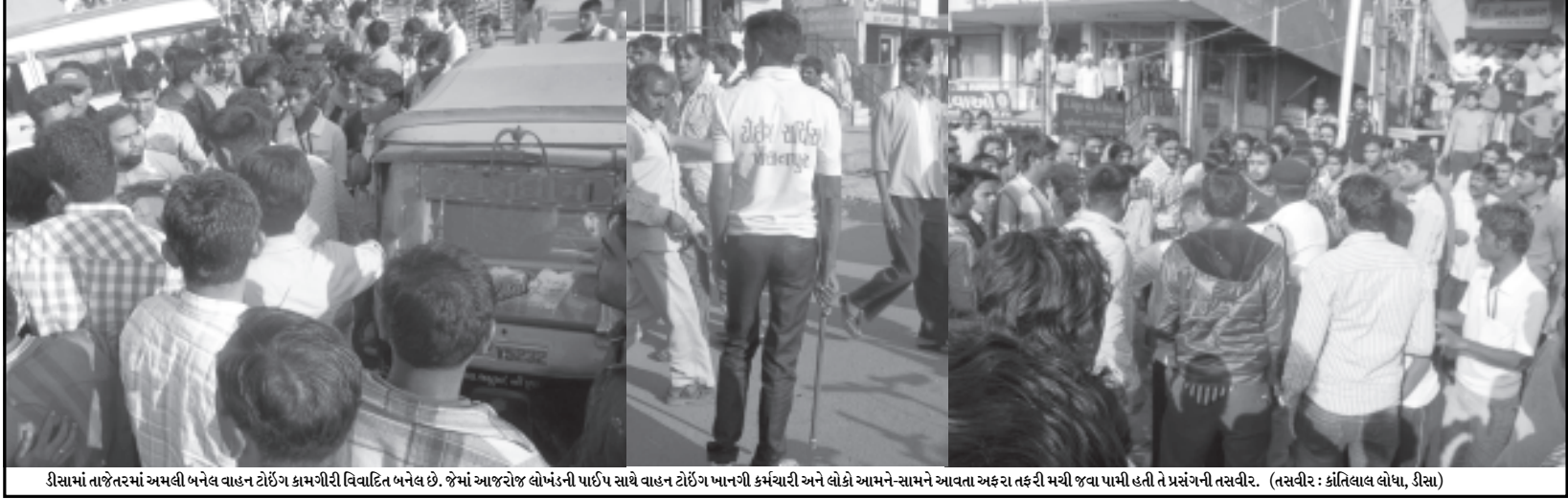
ડીસામાં તાજેતરમાં અમલી બનેલ વાહન ટોઈંગ કામગીરી વિવાદિત બનેલ છે. જેમાં આજરોજ લોખંડની પાર્ટપ સાથે વાહન ટોઈંગ પાનગી કર્મચારી અને લોકો આમને સામને આવતા અકરા તકરી મચી જવા પામી હતી તે પ્રસંગની તસવીર.