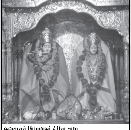
ભગવાનને શિયાળામાં ઠંડીના વાદ્યા ખેડબ્રહ્મામાં શ્રી રાધાકૃષ્ણ મંદિરમાં શિયાળાની ઠંડીમાં ભગવાનને શાલ ઓઠાડવામાં આવી.

નવનિર્મિત ગલ્લેતર તાલુકાના મુખ્યમથક સેવાલિયા ખાતે ગઈ કાલ રાત્રિએ ભગવાન ઈશુના ભક્તો ભજન-કીર્તન સાથે સાંતાકલોઝ બનેલા યુવાન સાથે નગરફેરી માટે નિકળ્યા હતા જેથી નાગરિકોમાં અનેરી ઉત્તેજના ફેલાઈ હતી. સાંતાકલોઝે બાળકોને ચો કલેટસ, પેન્સિલ-૨બર, કંપાસબેક્સ જેવી ચીકટ આપી તેમની સાથે રમત રમી ખુશ કરી દીધા હતા. તેમણે બાળકોને નવું વર્ષ ૨૦૧૪નું સ્વાગત કેવી રીતે કરવું તેમજ શું સાવધાની રાખવી તે અંગે પણ સલાહ આપી હતી. સાથે ભગવાન ઈશુનો સંદેશ પણ આપ્યો હતો. સાથે સાથે દરેકને મેરી ક્રિસમસ કહી શુભેચ્છાઓ પણ પાઠવી હતી.