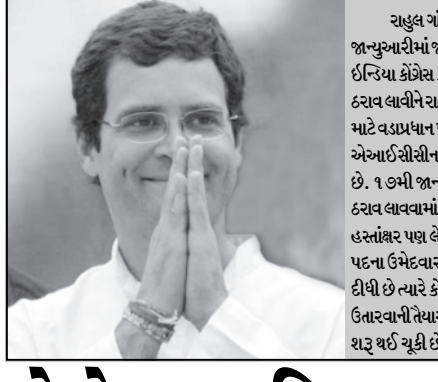
નવી દિલ્હી, તા. ૨૭ રાહુલ ગાંધીને વડાપ્રધાન પદના ઉમેદવાર તરીકે કોંગ્રેસ જાન્યુઆરીમાં જાહેર કરે તેવી શક્યતા દેખાઈ રહી છે. ઓલ ઈન્ડિયા કોંગ્રેસ કમીટીના મોટાભાગના સભ્યો આ બેઠકમાં ઈરાવ લાવીને રાહુલ ગાંધીને વર્ષ ૨૦૧૪ માં યોજાનારી ચૂંટણી માટે વડાપ્રધાન પદના ઉમેદવાર તરીકે જાહેર કરવા માંગે છે. એઆઈસીસીના કેટલાક સભ્યોએ ચર્ચા પણ શરૂ કરી દીધી છે. ૧૭મી જાન્યુઆરીના દિવસે એઆઈસીસીના સત્રમાં ઈરાવ લાવવામાં આવનાર છે. આ ઈરાવ ઉપર તમામ સભ્યોના હસ્તાક્ષર પણ લેવામાં આવશે. એકબાજુ ભાજપે વડાપ્રધાન પદના ઉમેદવાર તરીકે નરેન્દ્ર મોદીના નામની જાહેરાત કરી દીધી છે ત્યારે કોંગ્રેસ મોદીની સામે રાહુલ ગાંધીને મેદાનમાં ઉતારવાની તૈયારીમાં છે. આ મુદ્દા ઉપર તમામ સાથે વાતચીત શરૂ થઈ ચૂકી છે.