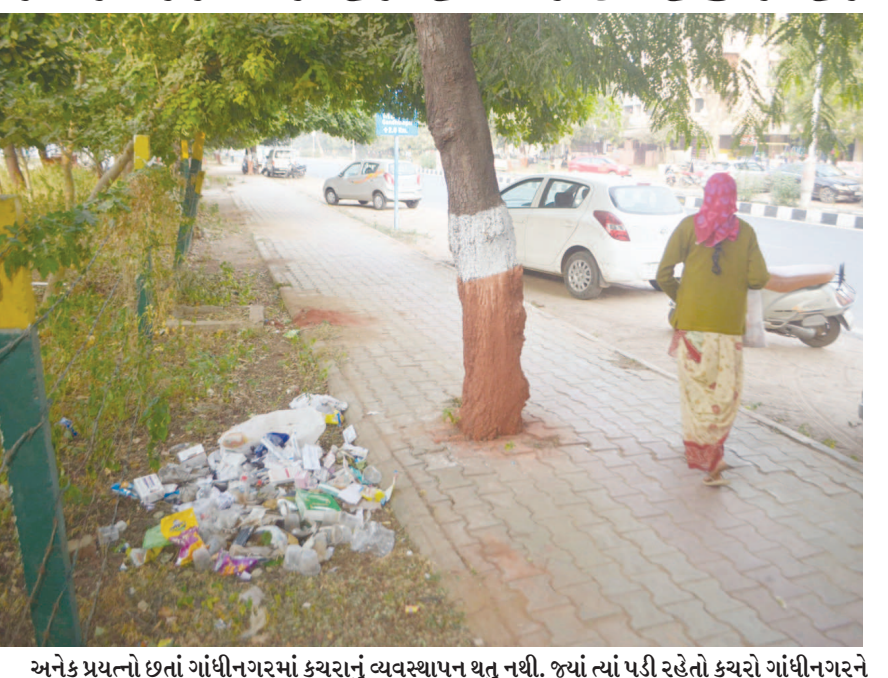
અનેક પ્રયત્નો છતાં ગાંધીનગરમાં કચરાનું વ્યવસ્થાપન થતુ નથી. જ્યાં ત્યાં પડી રહેતો કચરો ગાંધીનગરને ગંદકીથી ખદબદતુ બનાવે છે. ગ-૨ સર્કલ પાસે ગાયત્રી હોસ્પિટલ નજીક કચરો માર્ગ પર જ નાંખવામાં આવે છે. નજીકમાં જ કચરાપેટી હોવા છતાં કચરાનું વ્યવસ્થાપન થતું નથી.