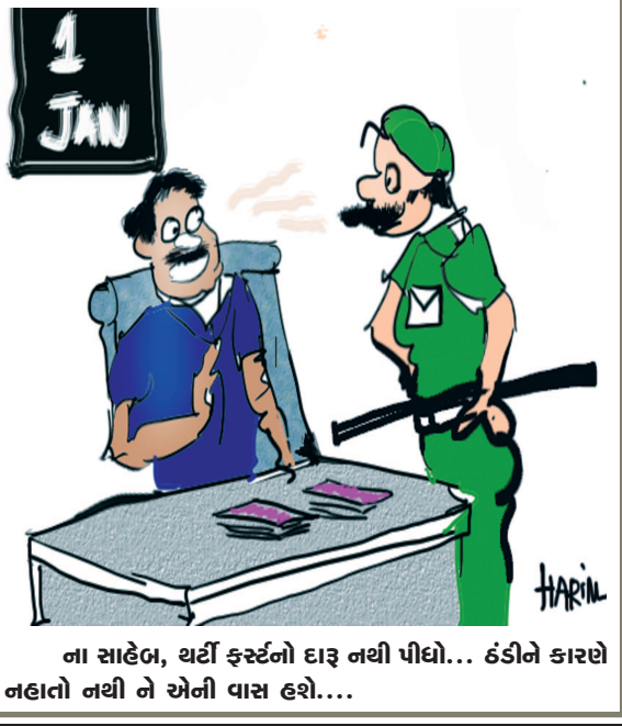
ના સાહેબ, થર્ટી ફરવનો દારૂ નથી પીધો... ઠંડીને કારણે નહાતો નથી ને એની વાસ હશે....