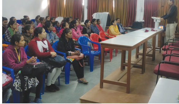
વિદ્યાર્થીનીઓ અને ગાંધીજીના જીવનના વિવિધ પ્રસંગોને સંકળીને માનવીય તથા સામાજિક જીવનનાં મૂલ્યો, ગુણો વિશે સમજ પૂરી પાડી

ગાંધીનગર, તા. ૨ ઉમા આર્ટ્સ અને નાથીબા કૉમર્સ મહિલા કોલેજ, ગાંધીનગરના સમાજશાસ્ત્ર વિભાગ દ્વારા સાંપ્રત સમાજમાં મહાત્મા ગાંધીના વિચારોની પ્રસ્તુતતા વિષયે વ્યાખ્યાનનું આયોજન કરવામાં આવ્યું હતું. ગુજરાત વિદ્યાપીઠના અનુસ્નાતક સમાજશાસ્ત્ર વિભાગના એસો. પ્રોફેસર ડૉ. રાજેન્દ્ર જાનીએ મનનીય અને પ્રેરક વક્તવ્ય આપ્યું હતું. તેમણે સમાજશાસ્ત્ર વિષયની