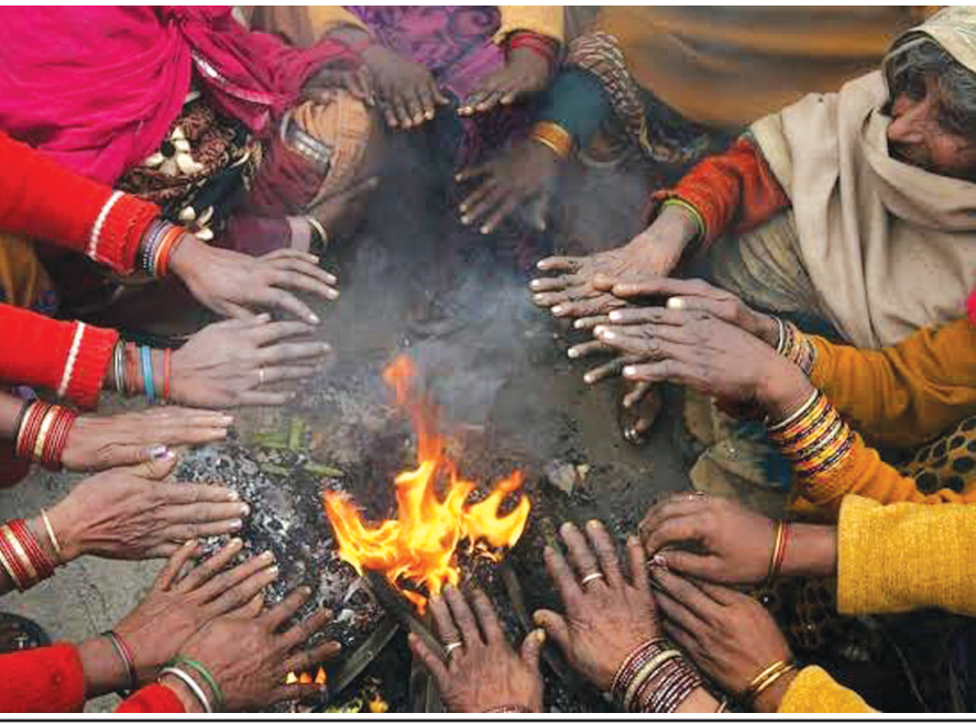
● અનુસંધાન પાન-૭ પર

ગાંધીનગર તા ૯ ગાંધીનગરમાં આજે કાતિલ ઠંડીનો મોજુ ફરી વળતા શહેર કોલ્ડવેવના સંક્રમણમાં આવી ગયું હતું. ઠંડીનો પારો ૭.૫ ડીગ્રીએ પહોંચી જતા સિઝનની રેકર્ડ બ્રેક ઠંડી નોંધાઈ હતી. શિયાળાની સિઝનમાં આજનો દિવસ સિઝનનો સૌથી ઠંડો પુરવાર થયો હતો. એક જ દિવસમાં ઠંડીનો પારો ૭ ડીગ્રી ગગડતા નગરજનોએ કાતિલ ઠંડીનો અનુભવ કર્યો હતો. આકરી ઠંડીના લીધે નગરનું જનજીવન પણ સુષ્ક પડી ગયું હતું. કાતિલ ઠંડી વચ્ચે પવનનું પણ જોર વધુ હોવાથી ઠંડીની અસર બેવડાઈ હતી જ્યારે પવનના લીધે વાતાવરણ ચિલ્ડ બનતા ઠંડીની મોસમ વધુ અસહ્ય બની છે. આક્રમક બનતી ઠંડીના લીધે નગરના માર્ગો પર વહેલી સવારે તેમજ રાત્રિના સમયે સજાટો છવાયેલો જોવા મળે છે. સાંજ ઢળતા જ સેક્ટરોની શેરીઓમાં સુનકાર પ્રવર્ત્યો હતો. આકરી ઠંડીએ નગરને ગિરફતમાં લેતા શ્રમિકોની હાલત પણ દયાજનક બની છે. ગાંધીનગરમાં આ વર્ષે ઠંડીનો મિજાજ અલગ જોવા મળી રહ્યો છે. ઠંડીના પારાની વધઘટ વચ્ચે મોસમનો મિજાજ બદલાતો રહે છે શહેરમાં અત્યાર સુધી ઠંડીનો પારો ૯ ડીગ્રીથી નીચે ઉતર્યો ન હતો પણ આજે લઘુત્તમ તાપમાન એક સાથે સીધું ૭ ડીગ્રી નીચે ઉતરી જતા સિઝનની રેકર્ડબ્રેક ઠંડી નોંધાઈ હતી. ઠંડીનો પારો ૭.૫ ડીગ્રી પહોંચી ગયો