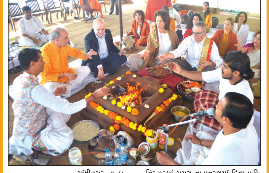
ગાંધીનગર, તા. ૯ આજે સવારથી ગાંધીનગરના સિમાડે રાંધેલા ચોકડી નજીક ખુશુમા વાતાવરણમાં વિસ્તારમાં સમગ્ર વાતાવરણમાં દિવ્યતાની અનુભૂતિ થઈ રહી હતી. સંસ્કૃતમાં ઉચ્ચારણ થઈ રહેલા આ શ્લોકો સાંભળીને એટલું તો