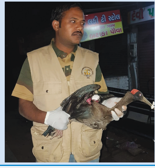
જેને સારવાર આપી શકાય તેવો હેતુ રહેલો છે. સેક્ટર-૧૭ ખાતેના મુખ્ય કન્ટ્રોલરૂમ પર આજે ૧૧ કબૂતર અને ૨ બ્લેકઆઈબીલને સારવાર અર્થે લવાયાં હતા જેમાંથી એક કાંકણસાર પક્ષીને અત્યંત ગંભીર ઈજાઓ હોવાથી સાબરમતી ખાતે લઈ જઈ કરૂણા અભિયાન સંલગ્ન બર્ડ રેસ્કયુ પોર્ટન્ટ પર હાજર વેટરનરી તબીબ પાસે સારવાર આપવામાં આવી હતી. આ ઉપરાંત ઈન્ડોડા પાર્ક ખાતે ગીર ફાઉન્ડેશનના બર્ડ રેસ્કયુ પોર્ટન્ટ પર આજે ૪ કબૂતર અને એક ઘુવડ સહિતના બગલાને સારવાર આપી તેનો જીવ બચાવી લેવાયો હતો.

જવા પામ્યું છે કે ૩૫ પર, થાંભલા પર કે મકાનોની છત પર ભરાઈને લટકી રહેલી પતંગની દોરી હજુ પણ અબોલ પંખીઓ માટે નડતરરૂપ બની રહી છે. શહેરમાં કેટલાક પતંગ રસિયાઓ ખાસ કરીને બાળકો દ્વારા પતંગો ચગાવાઈ રહ્યા છે જે પક્ષીઓ માટે ઈજાનું કારણ બની રહ્યું છે. શહેરમાં ઉત્તરાયણ નિમિત્તે શુક્ર કારાયેલા બર્ડ રેસ્કયુ સેન્ટર તથા હેલ્પલાઈન ચાલુ રાખવામાં આવી છે જેમાં ધાબા પર, વિજળી કે હોર્ડિંગ્સ અથવા ચેનલના વાયરો પર તથા વૃક્ષો પર કપાયેલી પતંગો તથા તેની દોરીઓ લટકી રહી છે. જેનાથી પક્ષીઓ ધાયલ થઈ રહ્યા છે