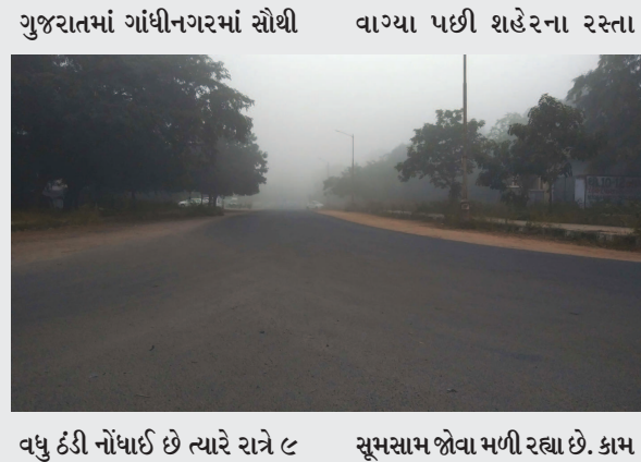
ગુજરાતમાં ગાંધીનગરમાં સૌથી વાગ્યા પછી શહેરના રસ્તા વધુ ઠંડી નોંધાઈ છે ત્યારે રાત્રે ૮ સુમસામ જોવા મળી રહ્યા છે. કામ

હવામાન ખાતાની આગાહી મુજબ હજુ શહેરમાં ઠંડી વધશે. આ બધી પરિસ્થિતિમાં શહેરના જનજીવન પર ઠંડીનો ગહેરો પ્રભાવ પડ્યો છે. વહેલી સવારે અને મોડી સાંજ બાદ શહેરના રસ્તા ખાલી જણાઈ રહ્યા છે. શહેરમાં છેલ્લા ઘણા દિવસથી ઠંડીનો મિજાજ સતત બદલાતો જણાઈ રહ્યો છે. આ સાથે શહેરજનો પણ પોતાના રોજીદા કાર્યોમાં ઠંડીમાં કામ સિવાય બહાર જવાનું ટાળી રહ્યા છે. સમગ્ર