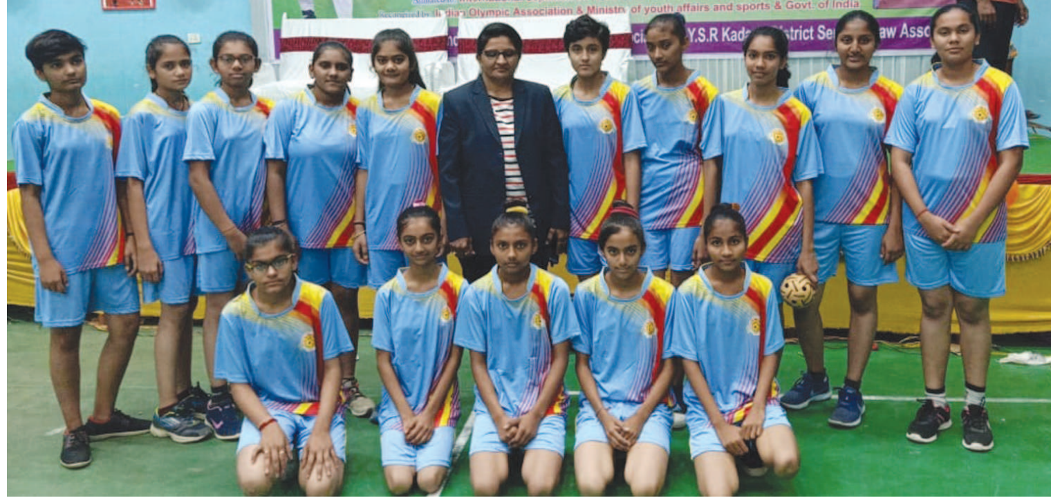
નેશનલ કક્ષાની સેપકટકરો રમત સ્પર્ધા આંધ્રપ્રદેશના કડપા જિલ્લામાં તાજેતરમાં યોજાઈ હતી. આ સ્પર્ધામાં શ્રી જે. એમ. ચૌધરી વિદ્યાલય, સેક્ટર-૭, ગાંધીનગરની વિદ્યાર્થીનીઓએ સિલેક્ટ થઈ ગુજરાતનું પ્રતિનિધિત્વ કર્યું હતું અને ઉત્કૃષ્ટ રમતનું પ્રદર્શન કરી પ્રેક્ષકોનાં દિલ પજા જતાં હતાં.