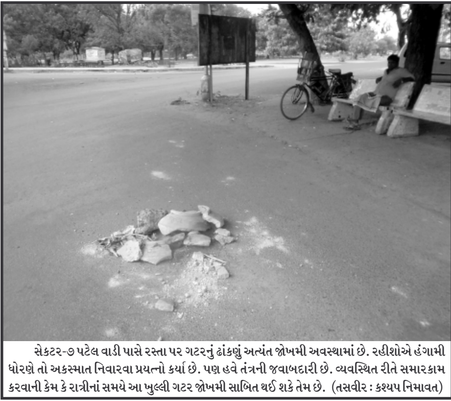
સેક્ટર-૭ પટેલ વાડી પાસે રસ્તા પર ગટરનું ઢાંકણું અત્યંત જોખમી અવસ્થામાં છે. રહીશોએ હંગામી ધોરણે તો અકસ્માત નિવારવા પ્રયત્નો કર્યા છે. પણ હવે તંત્રની જવાબદારી છે. વ્યવસ્થિત રીતે સમારકામ કરવાની કેમ કે રાત્રીનાં સમયે આ ખુલ્લી ગટર જોખમી સાબિત થઈ શકે તેમ છે.

ઘણી સોસાયટીઓમાં જાગૃત સંચાલકોએ આ ગુરખાઓને ઘર દીઠ ઉઘરાવાતા મહેનતાણાંની રકમ ફિક્સ કરી દીધી હોય છે પરંતુ જ્યાં આ પ્રકારની વ્યવસ્થા ન ગોઠવાઈ હોય ત્યાં આ ગુરખાઓ જે તે રહેવાસીની હેસિયત કે શક્તિ મુજબ મહેનતાણું માંગી લેતા હોય છે. આ ઉપરાંત વાર તહેવારે તેઓ રહેવાસીઓ પાસેથી ભેટ બક્ષીસ પણ મેળવતા હોય છે. આમ છતાં મોટા ભાગની સોસાયટીઓ જે હાઉસીંગ બોર્ડ દ્વારા નિર્માણ પામી છે તેમજ સરકારી વસાહતોમાં ક્યાંય વિધિસર રીતે તેમની નિમણુંક કરવામાં આવી હોતી નથી બલકે તેઓએ જાતે જ તેમની નિમણુંક કરી દીધી હોય છે.