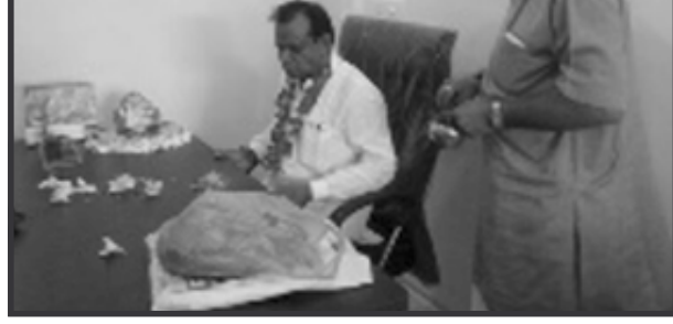
રાઠોડે જિલ્લાની જનતાના વિવિધ પ્રશ્નો અને લોકસેવા માટે હિંમતનગર કાર્યાલય વિધિવત રીતે પુલ્લુ મુક્યુ હતું. આ સાંસદ કાર્યાલયનું ઉદ્ઘાટન