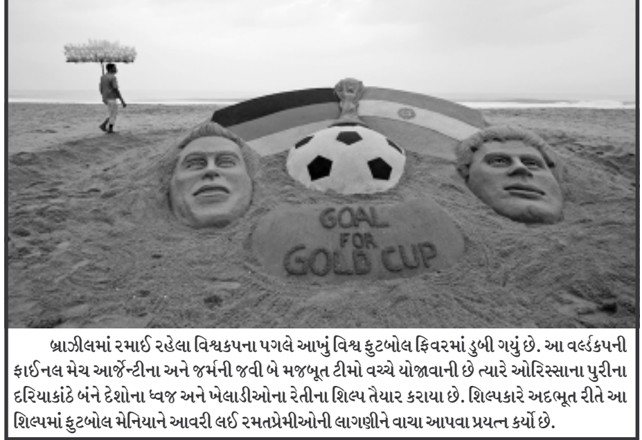
બ્રાઝિલમાં રમાઈ રહેલા વિશ્વકપના પગલે આખું વિશ્વ ફુટબોલ ફિવરમાં ડુબી ગયું છે. આ વર્લ્ડકપની ફાઈનલ મેચ આજે જારી અને જર્મની જવાબી મજબૂત ટીમો વચ્ચે યોજાવાની છે ત્યારે ઓરિસ્સાના પુરીના દરિયાકાંઠે બંને દેશોના ધ્વજ અને ખેલાડીઓના રેતીના શિલ્પ તૈયાર કરાયા છે. શિલ્પકારે અદભૂત રીતે આ શિલ્પમાં ફુટબોલ મેનિયાને આવરી લઈ રમતપ્રેમીઓની લાગણીને વાચા આપવા પ્રયત્ન કર્યો છે.

જમ્મુ, તા. ૧૨ પાકિસ્તાની સૈનિકોએ યુદ્ધવિરામના ભંગ કરવાનો સિલસિલો જારી રાખ્યો છે. આજે ફરી એકવાર પાકિસ્તાની સૈનિકોએ ભારતીય ચોકીઓને ટાર્ગેટ બનાવીને ગોળીબાર કર્યો હતો. નાના અને ઓટોમેટિક હથિયારો સાથે આ ગોળીબાર કરવામાં આવ્યો હતો. વરિષ્ઠ પોલીસ અધિકારી અને સેનાના અધિકારીઓએ માહિતી આપતા કહ્યું હતું કે, પાકિસ્તાની રેન્જરોએ આજે સવારે આંતરરાષ્ટ્રીય સરહદના અરણીયા સબ સેક્ટરમાં બીએસએફની ચોકીઓ ઉપર અંધાધૂંધ ગોળીબાર કર્યો હતો. પાકિસ્તાની જવાનોએ નાના હથિયારોનો ઉપયોગ આના માટે કર્યો હતો. બીએસએફના જવાનોએ પણ જોરદાર રીતે જવાબી કાર્યવાહી કરી હતી. ભારતના પશ્ચિમ ગોળીબારમાં કોઈ પુવારી થઈ ન હતી. છેલ્લા સમાચાર મળ્યા ત્યારે પણ ગોળીબારનો દોર જારી રહ્યો હતો. દરમિયાન જમ્મુ કાશ્મીરમાં ફરજ બજાવતા સુરક્ષા જવાનોએ કહ્યું છે કે, પાકિસ્તાની સૈનિકો ગોળીબારના બહાને આતંકવાદીઓને ભારતીય ક્ષેત્રમાં ઘુસાડવાના પ્રયાસમાં છે. જમ્મુ કાશ્મીરમાં બંને દેશો દ્વારા અંકુશરેખા પર સૈનિકો ગોઠવવામાં આવ્યા છે. એક બાજુ ભારતીય બાજુમાં આંતરરાષ્ટ્રીય સરહદ ઉપર બીએસએફના જવાનો ફરજ બજાવી રહ્યા છે. પાકિસ્તાની સૈનિકો દ્વારા વારંવાર બિનઉશ્કેરણીજનક રીતે ગોળીબાર કરવામાં આવે છે.