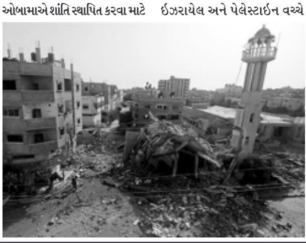
ઓબામાએ શાંતિ સ્થાપિત કરવા માટે ઈઝરાયેલ અને પેલેસ્ટાઈન વચ્ચે મધ્યસ્થી કરવાની ઈચ્છા વ્યક્ત કરી હતી. જો કે ઈઝરાયેલના વડાપ્રધાને આ સંબંધમાં શુ કહ્યું છે કે તે અંગે માહિતી મળી શકી નથી. હમાસ પણ યુદ્ધ વિરામ માટે વહેલી તકે રાજ થાય તેવી કોઈ શક્યતા દેખાઈ રહી નથી. નેતન્યાહુએ ઓ પેરેશન પ્રોટેક્ટિવ એજન્ડાની વાત કરી હતી. હમાસના ત્રાસવાદીઓ પણ લડાયક દેખાઈ રહ્યા છે. ઈઝરાયેલના ઉત્તરીય સરહદ પર ગેસ સ્ટેશન નજીક રોકેટ ઝીંકવામાં આવ્યા હતા. કુલ બે રોકેટ ઝીંકાયા હતા. જો કે

ગાઝા,તા. ૧૨ ઈઝરાયેલે ગાઝા પટ્ટી અને આસપાસના વિસ્તારોમાં આજે પાંચમાં દિવસે પહોંચી હુમલા જારી રાખ્યા હતા. છેલ્લા પાંચ દિવસના ગાળામાં હવાઈ હુમલામાં મોતનો આંકડો વધીને હવે ૧૩૦થી ઉપર પહોંચી ગયો છે. ઈઝરાયેલના હુમલા શરૂ થયા બાદથી પ્રથમ વખત લેબનોનમાંથી ઈઝરાયેલ પર રોકેટ હુમલા કરવામાં આવ્યા હતા. આજે સવારે ગાઝાપટ્ટીમાં ઈઝરાયેલે કરેલા હવાઈ હુમલામાં ૧૬