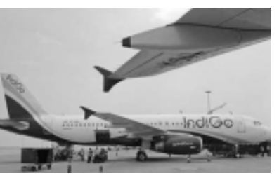
બગડોગરા-દિલ્હીની ફ્લાઈટમાં ૧૩૦ યાત્રી હતા. ઈન્ડિગોના પ્રવક્તાએ કહ્યું હતું કે ૩૦૦૦૦ ફુટ બની ઉંચાઈ પર જવાની મંજૂરી તેમને આપી દેવામાં આવી હતી. ઈન્ડિગોની ફ્લાઈટ

કોલકત્તા, તા. ૧૨ પશ્ચિમ બંગાળમાં બે વિમાનો ટકરાતા સહેજમાં બચી જતા તંત્રને મોટી રાહત થઈ છે. આ બન્ને વિમાનોમાં આશરે ૨૫૦ યાત્રીઓ હોવાનું જાણવા મળ્યું છે. સમગ્ર મામલે ઉડી તપાસ હાથ ધરવામાં આવી છે. બનાવ ગઈકાલે બપોરે બન્યો હતો. જો કે આ અંગે માહિતી વહેલી તકે જાહેર કરવામાં આવી ન હતી. બગડોગરાથી આવેલા ઈન્ડિગોના વિમાનની ટક્કર સહેજમાં પશ્ચિમ બંગાળમાં બગડોગરા પર રહેલા એર ઈન્ડિયાના વિમાન સાથે થતા રહી ગઈ હતી. આ બનાવ અંગે માહિતી આપતા ઈન્ડિગોના પ્રવક્તાએ કહ્યું છે કે