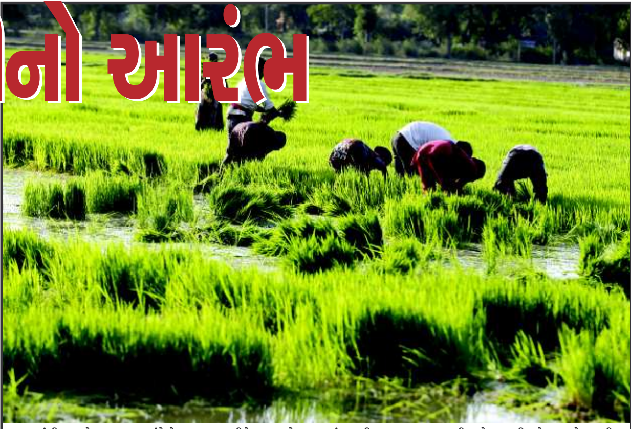
લાંબી રાહ જોવાડાયા બાદ અંતે મેઘરાજા મન મુકીને વરસ્યા છે. રાજ્યમાં વાવણી લાયક વરસાદ થતાની સાથે જ ધરતીપુત્રો પણ હવે વાવણીના કામમાં જોતરાયા છે. હસ્તા મોઢે વાવણીની શરૂઆત કરનાર ખેડૂતોના હૈયે સારા વર્ષની બંધાયેલ આશા જણાઈ આવે છે.

ગ્રામીણ વિસ્તારોમાં ખેડૂતો ખુશખુશાલ : વરસાદના નવા દોરથી દુષ્કાળના વાદળો દૂર થયા : જુદા જુદા પાકના ઉત્પાદનને લઈને પણ નવી આશા જાગી છે અમદાવાદ, તા. ૨૦ વરસાદના નવેસરના દોરના કારણે દુષ્કાળના વાદળો ટળી ગયા છે. આ ઉપરાંત અમદાવાદના ગ્રામીણ વિસ્તારોમાં ખુશીનું મોજુ ફરી વળ્યું છે. વાવણીની પ્રક્રિયા તીવ્ર રીતે શરૂ થઈ ચુકી છે. છેલ્લા કેટલાક દિવસથી કાળજાળ ગરમીની સાથે સાથે દુષ્કાળના વાદળો પણ ઘેરાયેલા હતા પરંતુ હવે વરસાદના પરિણામ સ્વરૂપે દુષ્કાળનો ખતરો ટળી ગયો છે. કૃષિ સાથે સંબંધિત પ્રવૃત્તિ તીવ્ર બની છે. ગ્રામીણ અમદાવાદમાં વાવણીમાં ખેડૂતો લાગી ગયા છે. અમદાવાદ શહેરમાં એક બાજુ વરસાદી માહોલથી લોકો વરસાદની મજા માણી રહ્યા છે ત્યારે બીજી બાજુ ગ્રામીણ વિસ્તારમાં કૃષિ પ્રવૃત્તિ તીવ્ર બની ગઈ છે. અમદાવાદની સાથે સાથે ગુજરાતમાં પણ વરસાદના આંકડા હવે ઉપલબ્ધ કરવામાં આવ્યા છે. દરેક ક્ષેત્રમાં રિકવરી જોવા મળી રહી છે. શહેરી પ્રવાહની વાત કરવામાં આવે તો અમદાવાદમાં સરેરાશ સિઝનલ વરસાદ ૭૭૨ મીમી રહે છે જેની સામે ૧૮મી જુલાઈ સુધી ૫૩૮.૮૮ મીમી વરસાદ નોંધાયો છે. બીજી બાજુ પ્રદેશમાં કચ્છમાં સરેરાશ સિઝનલ ૩૮૭ મીમી સામે હજુ ઓછો વરસાદ નોંધાયો છે પરંતુ ધીમે ધીમે સ્થિતિમાં સુધારો થયો છે.