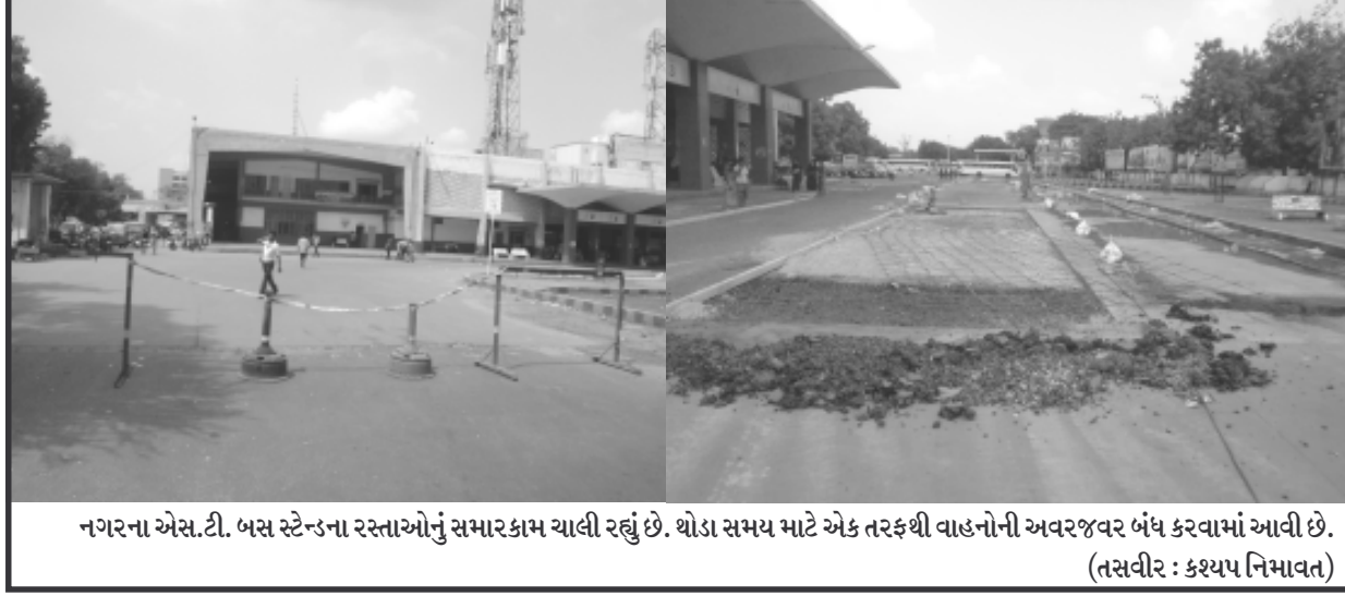
નગરના એસ.ટી. બસ સ્ટેન્ડના રસ્તાઓનું સમારકામ ચાલી રહ્યું છે. થોડા સમય માટે એક તરફથી વાહનોની અવરજવર બંધ કરવામાં આવી છે.

બન્યા હોવાનું આ દરમિયાન માલુમ પડે છે અને અનેક પીપીએફના નાના રોકણકારોએ વખતો વખત સહન કરવાનું આવ્યું છે. જેના લીધે ખાતેદારોમાં ઉગ્ર રોષની લાગણી પ્રવર્તી રહી છે. આ ખાતેદારો દ્વારા બેંકની સવાઓમાં તાકીદે સુધારો લાવવામાં આવે તે માટે ઉગ્ર માંગણી વ્યક્ત કરાઈ રહી છે. અન્યથા ખાતેદારોના તીવ્ર રોષનો ભોગ બનવું પડશે તેવી ચિમકી પણ ઉઠવાઈ છે.